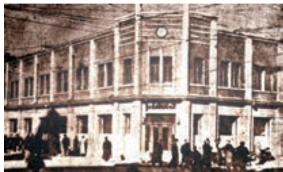
大公報舊址位於天津市和平區和平路169號。