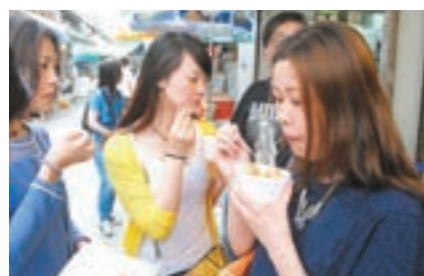
內地客在南丫島品嚐道地港式小食。資料圖片