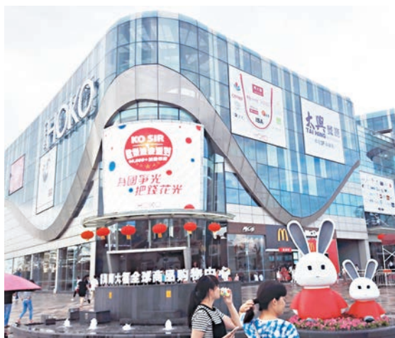
深圳前海港貨中心成為許多深圳居民購買港貨的新去處。

深圳消費者劉小姐告訴記者，她通過一些跨境電商平台購買歐洲奶粉、韓國化妝品和澳洲紅酒等，一個月便會花數千元購物。