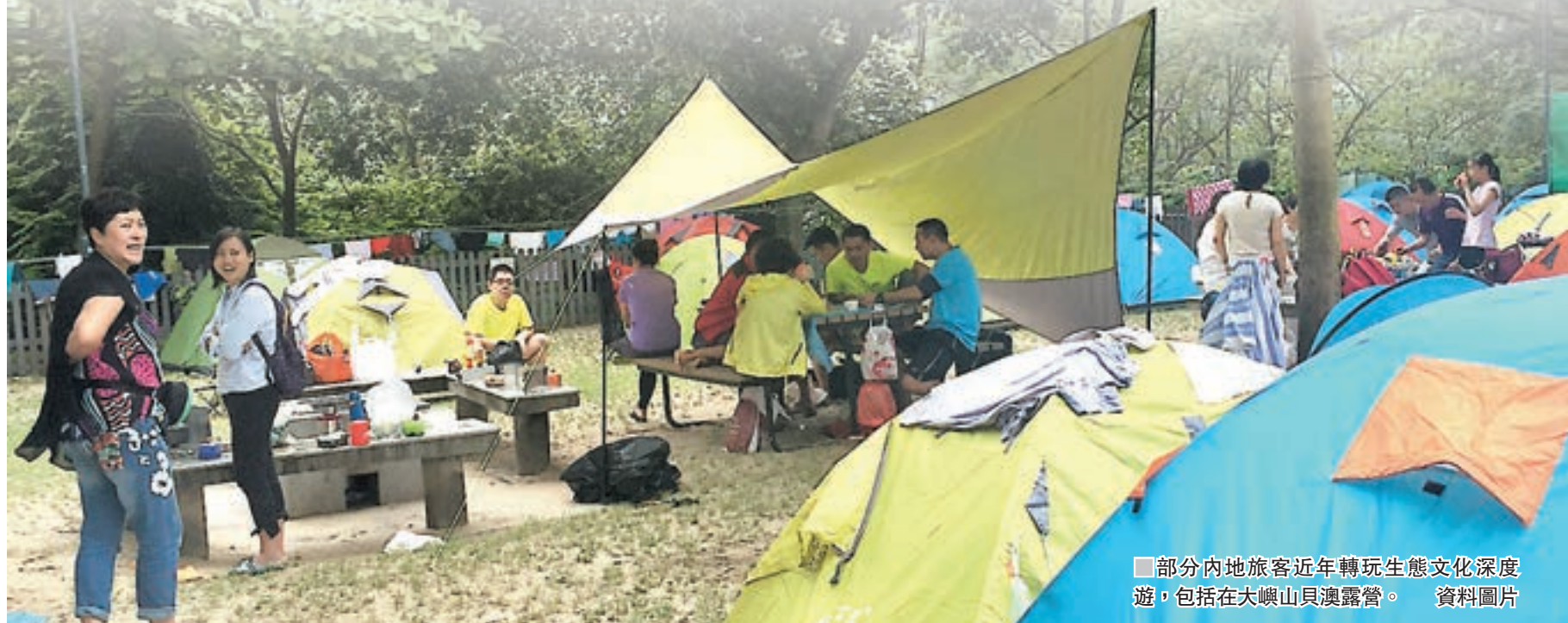
部分內地旅客近年轉玩生態文化深度遊，包括在大嶼山貝澳露營。資料圖片