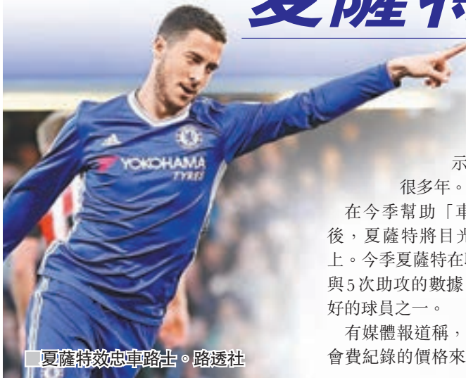
■夏薩特效忠車路士。路透社

夏薩特的名字過去幾周不斷與西甲皇家馬德里聯繫在一起，而球員昨日在接受採訪時表示，他想要留在「車仔」很多年。