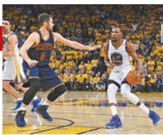
■騎士主將路夫(左)。