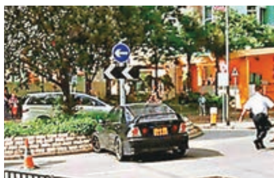
■涉案私家車撞向迴旋處花園後停下。