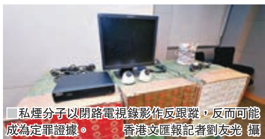
■私煙分子以閉路電視錄影作反跟蹤，反而可能成為定罪證據。