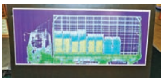
■文錦渡海關利用X光機揭發貨車偷運私煙。