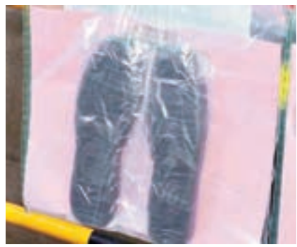
■藏有可卡因毒品的鞋墊。 電視截圖

事後大批警員趕至，在附近兜攔惜無發現。警員召來警犬協助搜查疑車，在車廂內發現少量毒品，又在車尾箱內檢獲12柄開山刀，稍後疑車及武器、毒品等證物一併帶署扣查。