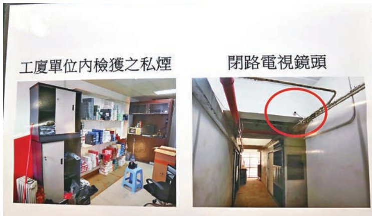
■搗破的私煙倉藏有大批私煙。

劉玉龍續指，不法分子的反監視及反跟蹤伎倆屬屬愚蠢，因為他們安裝的閉路電視亦拍下自己出入的記錄，將成為起訴證據之一。他相信海關的連續多日行動，已重創私煙集團的供應鏈。