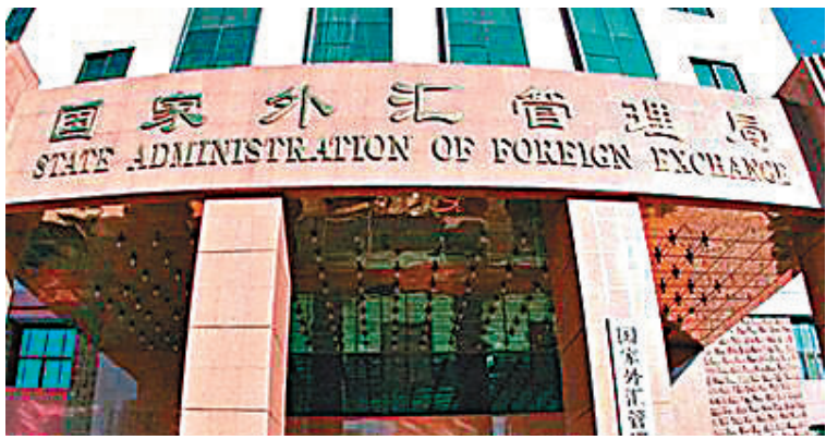
外匯局表示，自今年9月1日起，境內銀行卡在境外發生的提現和單筆金額1,000元人民幣以上的消費交易信息均需上報。

香港文匯報訊 國家外匯管理局昨天表示，將開展銀行卡境外交易信息採集工作。2017年9月1日起，境內銀行卡在境外發生的提現和單筆金額1,000元人民幣以上的消費交易信息均需上報，以完善銀行卡境外交易統計，維護銀行卡境外交易秩序。