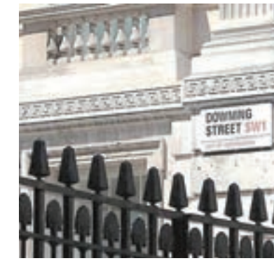
6月8日英國提前大選，首相文翠珊希望通過選舉爭取其在「英國脫歐」談判中的最佳結果。

英國首相文翠珊出乎意料地宣佈將於6月8日舉行選舉，該消息受到投資者歡迎。英國經濟正處於放緩的邊緣，這令政府更迫切需要舉行選舉。 繼文翠珊要求於6月8日舉行大選後，英國民眾即將再次走進投票站。文翠珊表示，需要透過舉行選舉增加她在英國脫歐談判中的籌碼及為英國爭取最佳的談判結果。 投資者對該消息感到興奮，推動英鎊兌美元升至自2016年9月以來最高水平。 冀取得更多數議席 文翠珊抱怨「其他政黨及上議院企圖阻擾談判進程」，但反對其計劃的很可能來自其所在的政黨。由於多數黨在下議院中僅有17個席