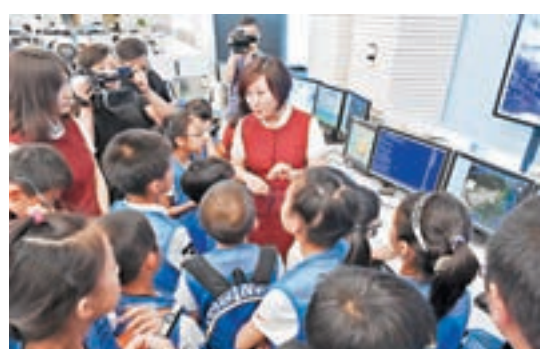
「小記者」們聽運控中心的阿姨介紹氣象常識。

同？」、「怎樣的搭配才能既營養又美味？」……品嚐着盤中的美食，小記者們依然問題連連，聆聽着航空餐食專家介紹的空中餐食選配的「講究」和「禁忌」，大家不住感嘆道：「誰知盤中餐，粒粒皆辛苦。原來這『辛苦』還有另一層含義！」從客艙禮儀到餐食文化再到空中餐食的選擇和製作，體驗着「金鳳乘務組」呈現的高品質國航兩艙餐食服務，在調動起味蕾的同時，大家紛紛感歎着小小客艙中「真講究」和「大學問」。