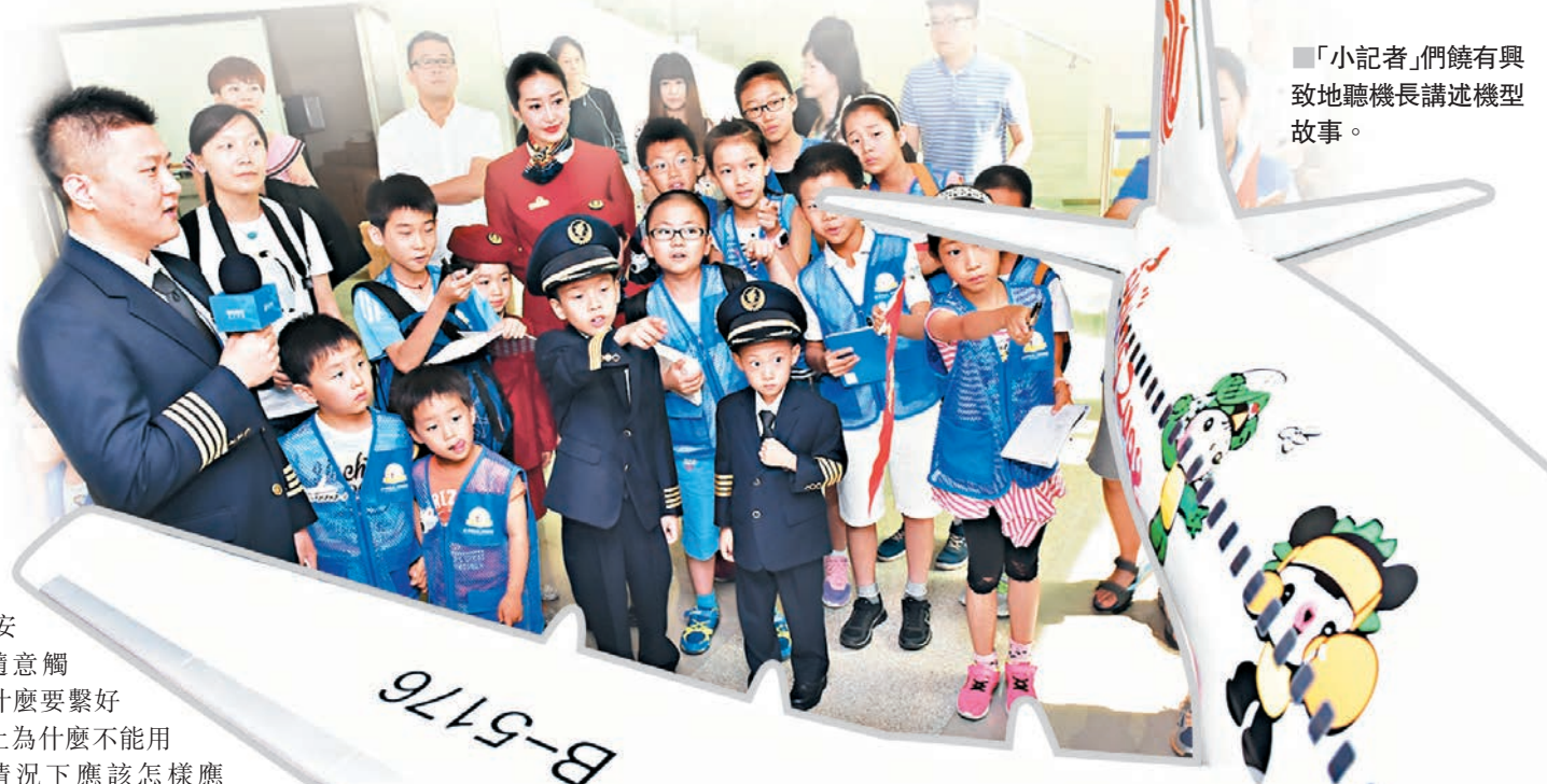
「小記者」們饒有興致地聽機長講述機型故事。