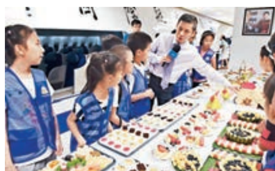
國航配餐專家介紹航空餐食的大學問。