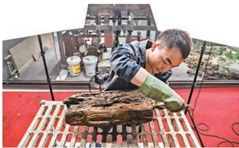
「華光礁1號」沉船保護實驗室用3D新技術幫助還原沉船「原形」。