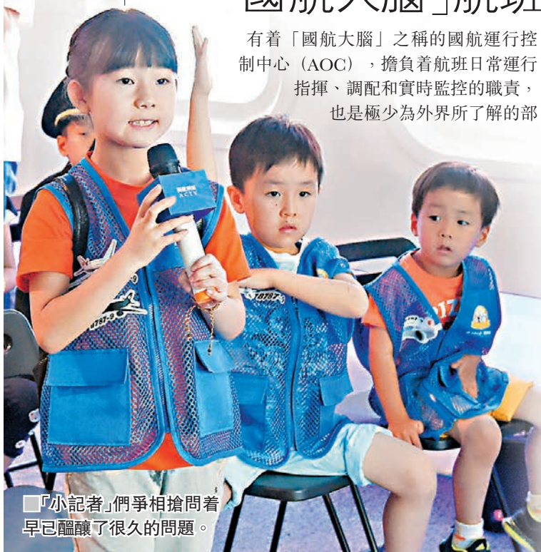
「小記者」們爭相搶問着早已醞釀了很久的問題。

在參觀過程中，大、小記者和來賓們也提出了諸如「延誤時航空公司為何不能準確給出起飛信息？」、「為什麼在知道飛機不能馬上起飛的情況下，還要讓旅客提前登機在機艙內等待？」、「航空公司經常說受流量控制影響，究竟什麼是流量控制？」等「尖銳」的問題，國航運行控制中心負責人本着實事求是的態度，一一進行了細緻誠懇的解答。針對已經到來的雷雨季天氣，大、小記者們也提出了各自的問題，國航的各項保障設施和出行提示也得到了大家的高度認同。