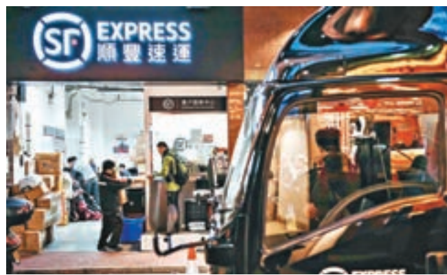
香港很多淘寶商家都使用順豐快遞服務，阿里從物流選項中剔除順豐影響重大。資料圖片

據澎湃新聞報道，2015年6月，順豐、申通、中通、韻達、普洛斯五家物流公司共同投資成立深圳市豐巢科技有限公司，研發運營面向所有快遞公司、電商物流使用的24小時自助開放平台「豐巢」智能快遞櫃，以解決快遞末端難的問題。豐巢在2016年跟菜鳥合作，內容包括：菜鳥提供消費者手機號信息