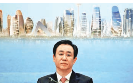
恒大股價上月下旬起走勢強勁。圖為主席許家印。

恒大股價自5月下旬起走勢強勁，曾連續7天破頂，最高見15.78港元；昨收報14.32港元升2.43%。