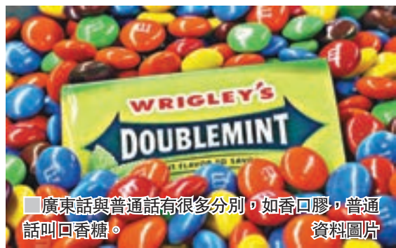
廣東話與普通話有很多分別，如香口膠，普通話叫口香糖。

《現代漢語辭典》對「性」有多種解釋，一般人最易聯想到的是指兩性之間的性慾，也可指性別、性格、物質的性能，這裡所談的「一次性」則屬後綴詞，普通話習慣加在名詞或形容詞後，當做抽象名詞或屬性詞使用，港人較不常用的有「可視性」，指在影視作品的內容吸引人，使觀眾愛看的特性，較常見的例如：可行性、可塑性、普遍性、創造性、流行性……等。坊間近年也衍生一些新詞，例如「可比性」，指兩者之間是否存在能用來比較的特性。