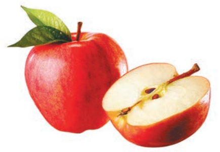
以前老師多教 A for apple，現在 A 要 for Astronaut 才能「贏在起跑線」。

根據美國電影標準，評為 G 級的電影乃屬 General Admission，適合任何年齡人士