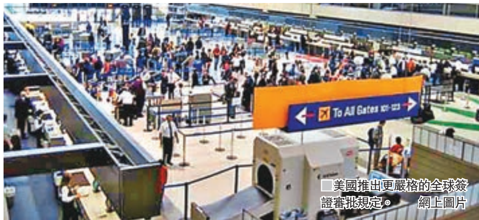
■ 美國推出更嚴格的全球簽證審批規定。 網上圖片

在新規定下，美國領事館職員可索取申請人此前的所有護照號碼，倘若要進一步確認身份，可要求取得更多資料。雖然填寫問卷屬自願性質，但當局已列明，如果不能提供資料，或導致申請簽證過程受阻甚至無法處理。有律師指出，申請人難以完全記起所有社交媒體賬戶或過去15年的詳細個人資料，或不慎提供錯誤資料，使當局有可能「殺錯良民」。伊朗裔美國律師協會主席尤西非利德罕表示，新聞卷容許領事館職員可隨意行使權力，就誰人可獲批簽證作決定，但缺乏監管。