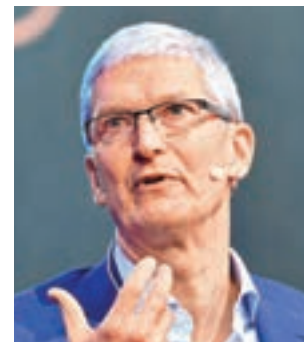
■ 美國不少企業高層，包括庫克及馬斯克均反對美國退出協定。

美國總統特朗普於香港時間今日(周五)凌晨3時，宣佈是否退出限制溫室氣體排放的《巴黎協定》，多間傳媒披露他已決定退出。支持煤炭行業的共和黨人認同特朗普兌現競選承諾，然而眾議院少數黨領袖佩洛西表示，此舉意味美國放棄國際社會間的領導地位。中國及歐盟計劃在今日的布魯塞爾峰會上發表聯合聲明，重申落實協定的決心。歐盟委員會主席容克表示，歐洲必須向美方表明退出《巴黎協定》並非一句話了事，而是需時數年的過程。