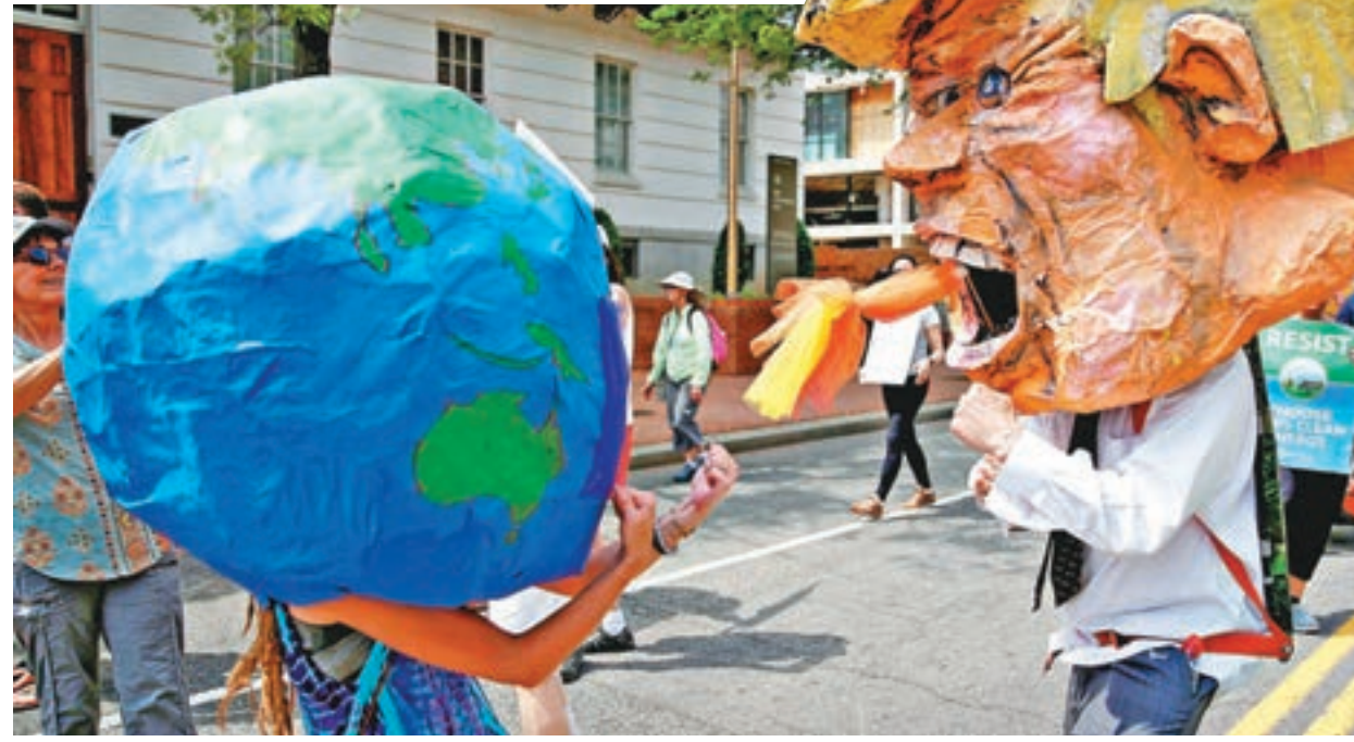
■ 特朗普或退出《巴黎協定》，掀起爭議。圖為早前示威者抗議特朗普不支持氣候變化協議。