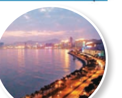
在夕陽與華燈映襯下的珠海情侶路。

情侶路是珠海沿海道路，從南向北長達28公里，因其風景秀麗、海濤陣陣、空氣清新，成為珠海市民特別是情侶們休閒散步的好去處，這也是情侶路路名的由來。 「珠海情侶路」已是珠海的最知名的一張城市休閒旅遊名片，白天沿着蜿蜒的香爐灣一路走來，藍天、白雲、陽光、沙灘、海浪、海鷗、鮮花，風景美不勝收；登至景山公園山頂，北眺香港，南望澳門，放眼蜿蜒海邊的「情侶路」，即可看到近在咫尺的「日月貝」大劇院、「香爐」漁女、港珠澳大橋等地標建築，倍感「浪漫之城」現代而浪漫的氣息。 憑欄聽濤 低語相擁 夕陽西下，沿情侶路途經海灣大酒店、九洲港、珠海漁女等著名風景旅遊點，像經過了一條飄逸的巨幅綢帶，從珠海市東頭的香洲蜿蜒逶迤至與澳門接壤處的拱北口岸，小情侶們依山傍海，憑欄聽濤，在秀麗而溫馨的景色中低語相擁。