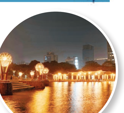
千燈湖公園內各種塔燈、柱燈等逾1,300盞匯聚成千燈夜景，夢幻迷人。

千燈湖位於廣東省佛山市南海區桂城街道，它南起海三路雷崗公園北門，北至海八路；東、西兩側有南七、南八兩條城市景觀路全線貫通，東西寬約280米，佔地約302畝；為全開放式公園。公園主要由兩部分組成，即千燈湖和市民廣場。 千燈湖是佛山最大的免費公園之一，由美國著名的SWA環境設計公司組織設計，曾經獲得全球景觀設計行業的「奧斯卡」獎——「全球城市開放空間大獎」，慕名而來的遊客絡繹不絕。如今，作為桂城乃至南海區的「城市會客廳」，千燈湖每年接待各地遊客近百萬。 千燈燈彩 五光十色 公園還配置了兒童遊樂場及卵石健身徑、健身器材等設施，滿足了公園的多樣化需求。每到中秋節、春節等傳統節日，公園還會上演精彩的「採燈」表演，被市民評為佛山地區目前「最浪漫」的公園。