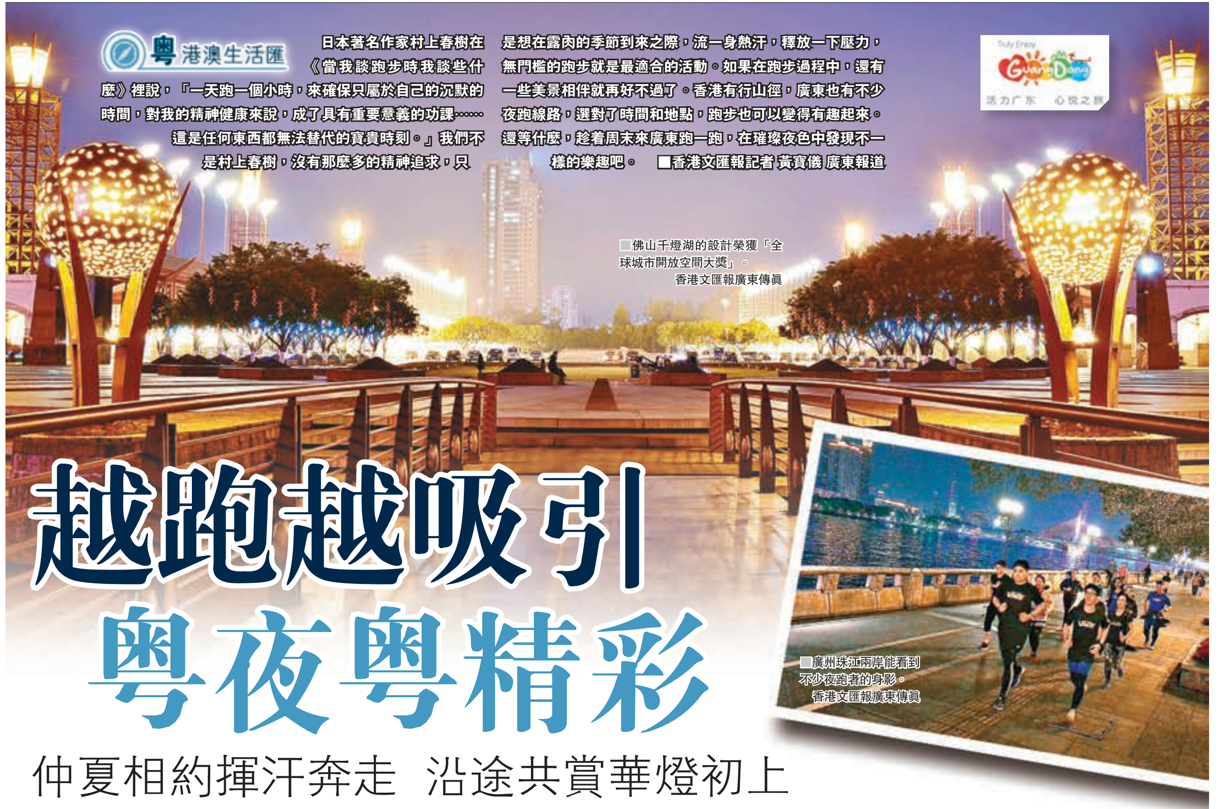
佛山千燈湖的設計榮獲「全球城市開放空間大獎」。