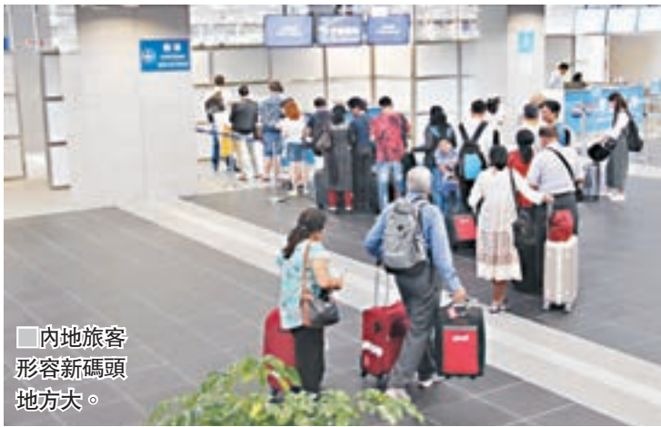
內地旅客形容新碼頭地方大。

氹仔客運碼頭從昨日清晨6時開始對外開放，意味着服務約10年的臨時碼頭正式走進歷史，3間客船公司亦將7條航線的服務全部轉移到新碼頭，碼頭啟用後會24小時運作，客船的航線與班次不變。