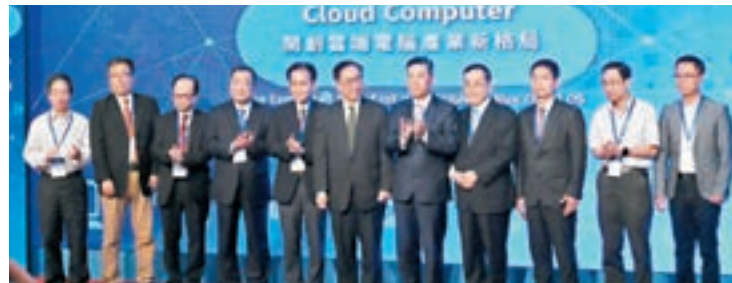
■由灼見名家主辦、數碼港協辦的「開創雲端電腦產業新格局」論壇。