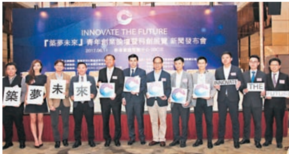
■「築夢未來」青年創業論壇暨科創展覽6月11日於會展舉行，主辦單位首長出席發佈會。

主辦本次活動，旨在推動本地創新創業的思潮和科創產業發展，希望通過系列論壇和創新創業成果的交流和展示，架起資本與實業、創業投資和創業項目、創意和人才之間的橋樑，推動香港和深圳兩地聯動發展，促進各方攜手並肩實現國家創新發展戰略。