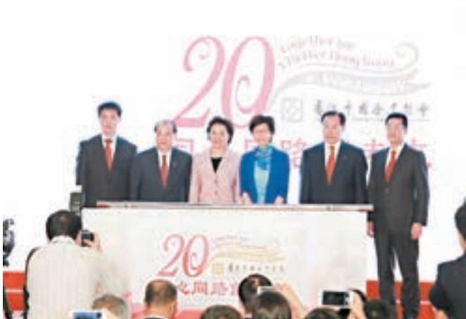
■左起：徐永、張建宗、仇鴻、林鄭月娥、張學武、蔡永中主持啓動儀式。

她續指，隨國家對外開放戰略向縱深發展，香港將迎來新的發展機遇，希望中資企業能夠不忘初心、植根香港、服務香港，為「一國兩