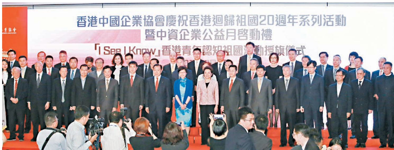
■中企協慶回歸系列活動暨「中資企業公益月」啓動禮，賓主合照。