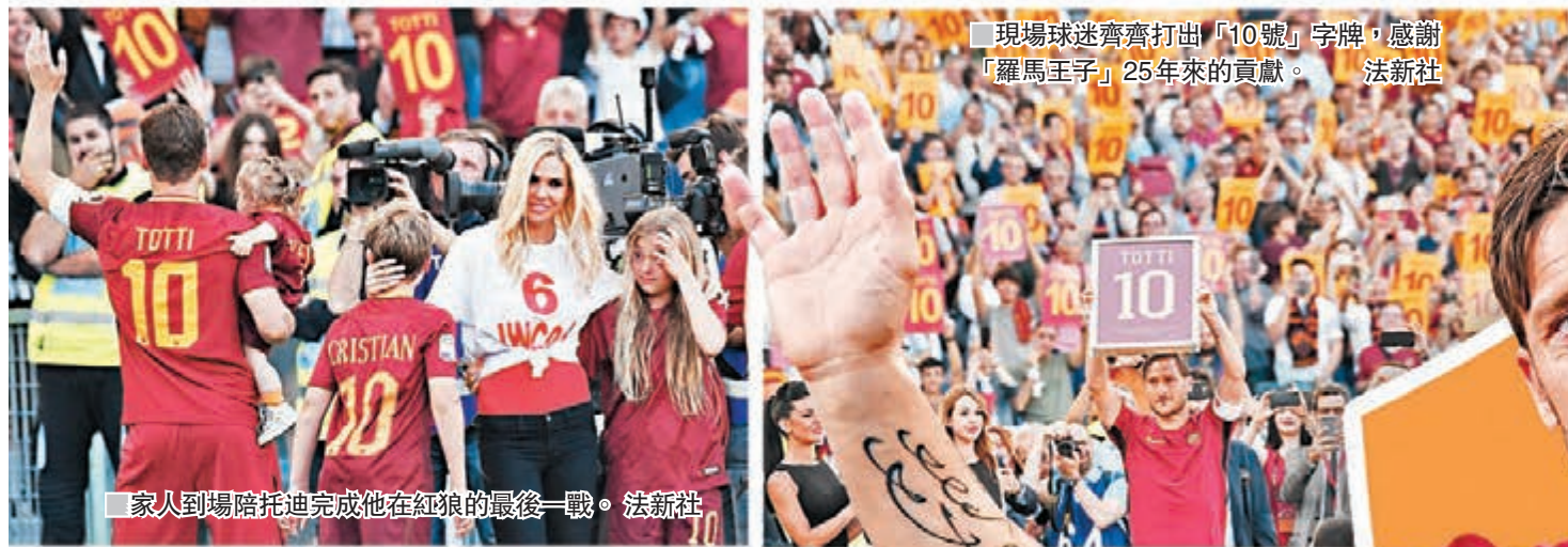
■現場球迷齊打出「10號」字牌，感謝「羅馬王子」25年來的貢獻。