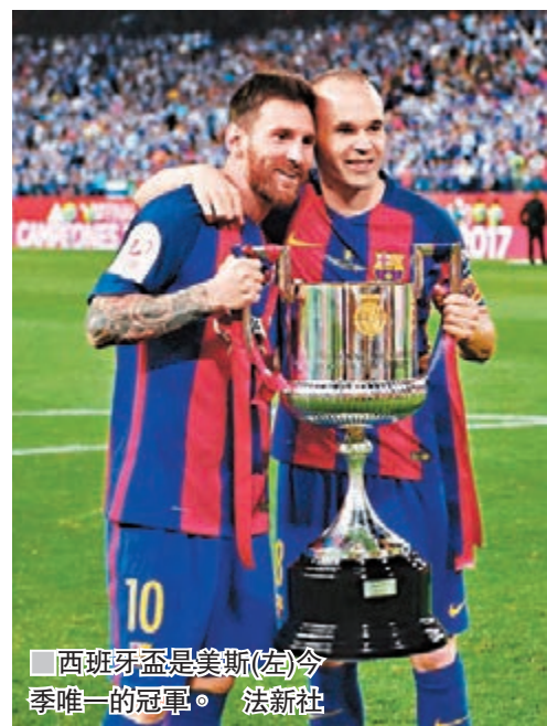
■西班牙盃是美斯(左)今季唯一的冠軍。

昨日，意甲聯賽第38輪的收官戰結束，迪斯高今季一共攻入29球獲得了意甲聯賽金靴，但他無法撼動美斯歐洲金靴的地位。至此，歐洲主流聯賽落幕，美斯確定以37球拿到歐洲金靴獎，這是西甲巴塞那天王職業生涯第四次拿到歐洲金靴，獲獎次數追平C朗。