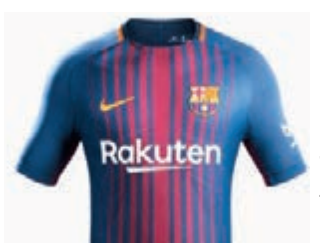
■巴塞公佈下季球衣衣式樣。巴塞圖片

另外，西甲球會切爾達昨日宣佈挖走前巴塞主帥安歷基的助手安素，下季接掌兵符，50歲的安素與切爾達簽下兩年合約。切爾達同時宣佈，安素帶來3名教練團班底。安歷基離職執教3年的巴塞，安素也決定自立門戶。報道指，上周宣佈已離開畢爾包帥位的華維迪會回巢球員時代効力過的巴塞成為新任主帥。另巴塞昨晚宣佈與德國門將達史特根續約到2022年。 ■香港文匯報記者 梁啓剛