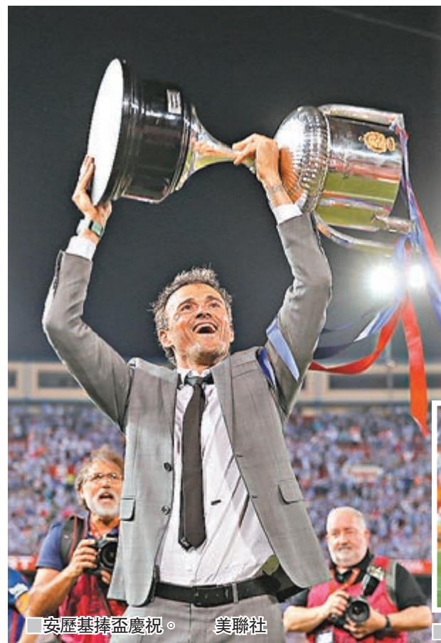
安歷基捧盃慶祝。

西班牙盃決賽昨日舉行，巴塞羅那以3:1戰勝艾拉維斯，捧起冠軍獎盃。面對歷史上首次打入西班牙盃決賽的對手，巴塞羅那表現強勢。儘管蘇亞雷斯停賽，但美斯、尼馬和柏高艾卡沙的入球為巴塞在上半場結束前便鎖定了勝局。這也是巴塞連續三年奪得西班牙盃冠軍。 上半場，艾拉維斯有一腳射門擊中門柱，因而錯過了取得領先的機會。巴塞則在第30分鐘由美斯打破僵局，阿根廷人與尼馬進行撞牆配合後在禁區邊緣將球射入球門左下角。4分鐘後，艾拉維斯在巴塞禁區前沿獲得任意球，菲奧勒南迪斯罰出的皮球直接入球門遠角，將比分扳為1:1。 上半場結束前，巴塞連續攻入兩球。第45分鐘，高美斯禁區右路送出傳中，尼馬在後點將球輕鬆撥入空門。半場補時階段，美斯在禁區前沿橫向帶球擺脫對方球員防守後送出直傳，柏高艾卡沙小禁區角上將球射入遠角。下半場雙方都未能再取得入球，比分鎖定在3:1。