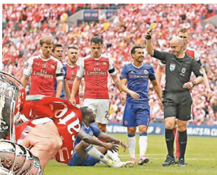
域陀摩西斯(下)領第二面黃牌被逐離場。

阿仙奴昨日在溫布萊球場舉行的英格蘭足總盃決賽中，以2:1擊敗英超冠軍車路士，第13次贏得英格蘭足總盃冠軍。因為今季一直在「走與留」之間徘徊，雲加極有可能因為這場勝利而繼續他在阿仙奴的執教生涯，這也是他入主阿仙奴21年來，第7次捧起足總盃，使阿仙奴成為贏得足總盃冠軍次數最多的球隊，也多少可以彌補20年來首次未能獲得歐聯參賽資格的遺憾。