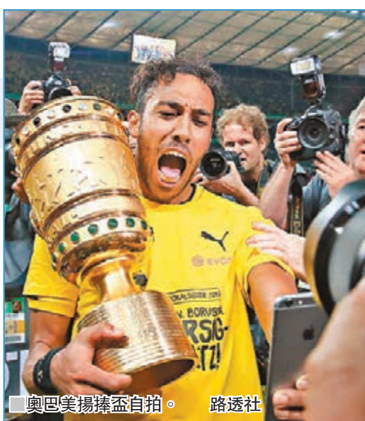
奧巴美揚捧盃自拍。

「宿命」。但多蒙特的勝利來得並不輕鬆，儘管奧斯文尼迪比利在第8分鐘便從右路內切，用一記漂亮的弧線球為球隊取得夢幻開局，但法蘭克福在29分鐘把握住一次機會，由列比錫接應妙傳，將比數扳平。此後，奧巴美揚及時站了出來，他先是在第64分鐘打出精彩的倒掛射門，但被對方門將撲出，而當基斯甸普列錫在禁區內導致12碼後，奧巴美揚冷靜地將這次關鍵的機會轉化為入球，幫助球隊取勝。 ■新華社