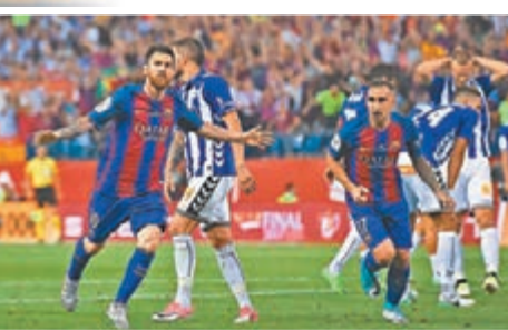
美斯(左)慶祝入波。

西班牙盃決賽昨日舉行，巴塞羅那以3:1戰勝艾拉維斯，捧起冠軍獎盃。面對歷史上首次打入西班牙盃決賽的對手，巴塞羅那表現強勢。儘管蘇亞雷斯停賽，但美斯、尼馬和柏高艾卡沙的入球為巴塞在上半場結束前便鎖定了勝局。這也是巴塞連續三年奪得西班牙盃冠軍。 上半場，艾拉維斯有一腳射門擊中門柱，因而錯過了取得領先的機會。巴塞則在第30分鐘由美斯打破僵局，阿根廷人與尼馬進行撞牆配合後在禁區邊緣將球射入球門左下角。4分鐘後，艾拉維斯在巴塞禁區前沿獲得任意球，菲奧勒南迪斯罰出的皮球直接入球門遠角，將比分扳為1:1。 上半場結束前，巴塞連續攻入兩球。第45分鐘，高美斯禁區右路送出傳中，尼馬在後點將球輕鬆撥入空門。半場補時階段，美斯在禁區前沿橫向帶球擺脫對方球員防守後送出直傳，柏高艾卡沙小禁區角上將球射入遠角。下半場雙方都未能再取得入球，比分鎖定在3:1。