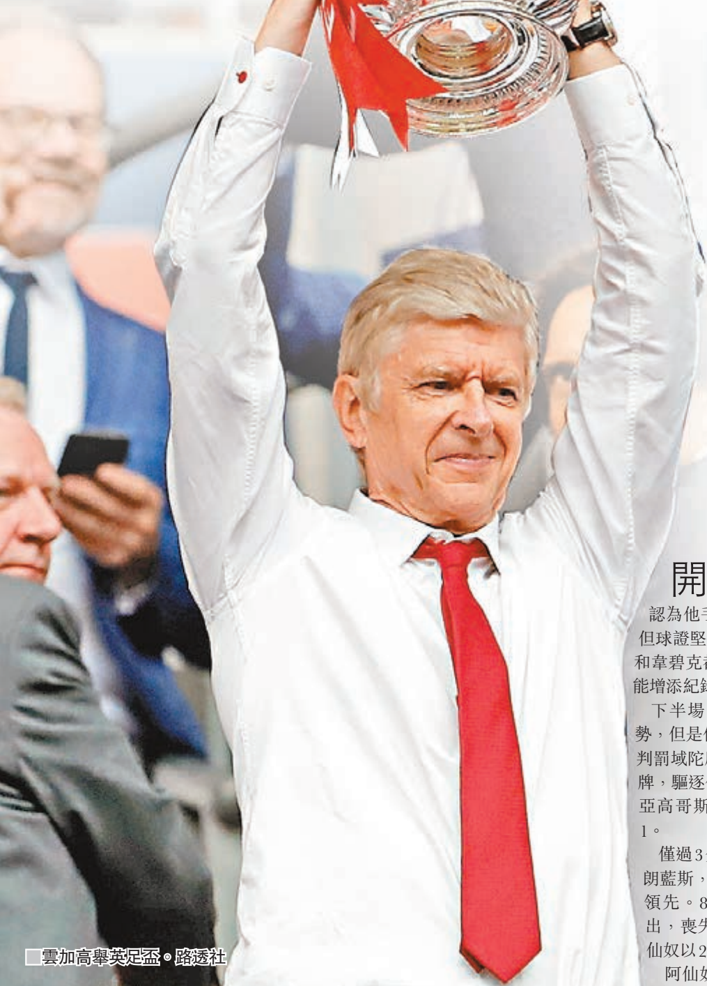
雲加高舉英足盃。

開場僅四分，阿歷斯山齊士搶球，單刀闖入禁區勁射破門，未知旁證認為他手球在先或是有其他球員犯越位，但球證堅持認定入球有效。之後，艾朗藍斯和韋碧克都有非常好的機會，但只差少少未能增添紀錄，上半場阿仙奴以1:0領先。 下半場，車路士加強進攻，希望扭轉頹勢，但是他們在68分鐘遭遇巨大打擊，球證判罰域陀摩西斯插水，對他出示了第二張黃牌，驅逐他離場。76分鐘，韋利安挑傳，迪亞高哥斯達胸部停球後凌空抽射破門，1:1。 僅過3分鐘，剛剛上場的基奧特傳中給艾朗藍斯，後者頭槌建功，阿仙奴以2:1再次領先。87分鐘，奧斯爾射門擊中立柱彈出，喪失了一次擴大比分的機會，最終阿仙奴以2:1贏波。 阿仙奴賽前與曼聯都曾經12次贏得足總盃冠軍，這場勝利讓他們超越對手位居奪冠次數第一，這也是阿仙奴第20次打入足總盃決賽。