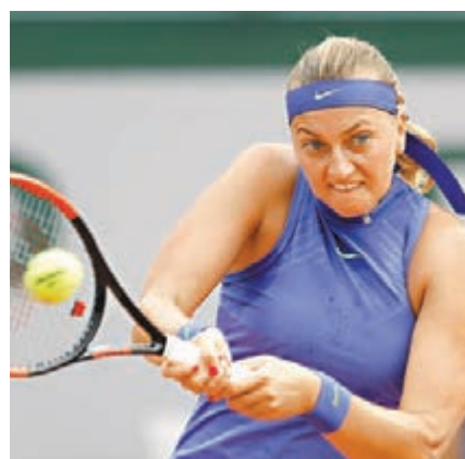
姬維杜娃在比賽中擊球。

法網昨日開鑼，兩屆溫布頓網賽冠軍姬維杜娃，4個月前，被持刀賊入屋行劫，其間受傷，一度以為從此遠離網球運動，休戰多月後終於在今年法網復出，再踏球場；這位外號「新女金剛」的捷克名將，在女單首圈以6:3及6:2擊敗美國球手寶莎立，復出首仗即贏。(now670及671今日5:00p.m.直播第二日比賽)