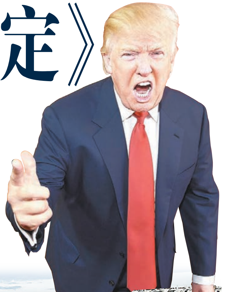
有傳特朗普已向環保局局長等人士透露，他決定退出《巴黎協定》。

剛結束的七國集團(G7)峰會，各成員國未能就應對氣候變化問題達成共識，美國總統特朗普表示會在未來一周內，就是否退出限制溫室氣體排放的《巴黎協定》作最後決定。但網絡媒體Axios前日引述3名消息人士指，特朗普已向環保局局長普魯伊特等人士透露，他決定退出《巴黎協定》。分析指出，美國身為全球第二大溫室氣體排放國，一旦退出將削弱協定的成效，同時會付上高昂政治代價，並面對美國環保團體及潔淨能源公司強烈抗議。