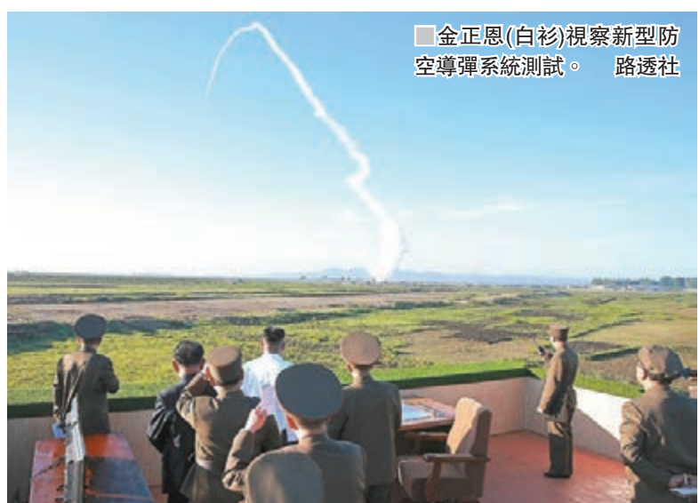
金正恩(白衫)視察新型防空導彈系統測試。

「通俄門」調查持續擴大，特朗普女婿庫什納更被爆出向俄提議設立秘密溝通渠道。特朗普回國後將盡力「救火」，最快昨日與負責通俄調查辯護工作的律師卡索維茲會面，並於日內與多名處理政治調查案經驗豐富的律師見面，游說他們加盟「作戰室」。 ■美聯社/紐約時報