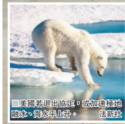
美國若退出協定，或加速極地融冰、海水平上升。

特朗普在競選期間，曾指全球暖化是騙局，要求溫室氣體排放標準更具彈性，避免其他國家佔美國好處，美企卻要承擔沉重成本，白宮內部就退出協定還是重新制訂協議展開激辯。特朗普日前在G7峰會上，儘管面對其他成員國首腦在氣候議題上施壓，但他未有退讓，僅表示「留待下周決定」，最終峰會公報只列明「美國正審視自身氣候政策及《巴黎協定》立場，故未能與其餘各國達成共識」。