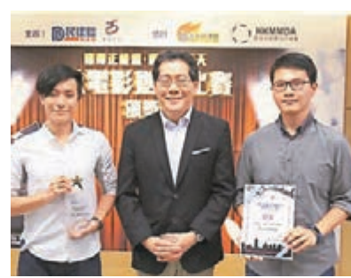
蘇錦樑與得獎者合照。