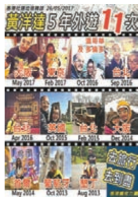
「香港癩佬力量」力數狗達兩公婆5年去11次旅行。

皇后諗住「母儀天下」好優雅咁寸返班「癩佬」，點知開口夾着脷，將一年兩次出門形容係「寒酸」，就俾班「癩佬」斷正，起勢咁話佢侮辱一年可能連