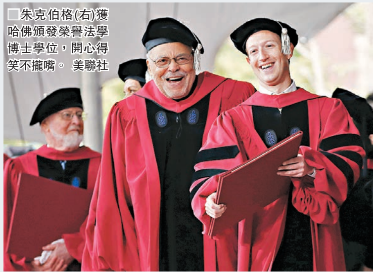
朱克伯格(右)獲哈佛頒發榮譽法學博士學位，開心得笑不攏嘴。

社交網站facebook(f)創辦人朱克伯格2004年5月從美國哈佛大學輟學，埋首發展fb，事隔13年後重回母校，領取校方頒發的榮譽法學博士學位。他在演講時寄語畢業生，應以創造所有人都具使命感的世界為目標，對抗不平等，以及強化全球社群。