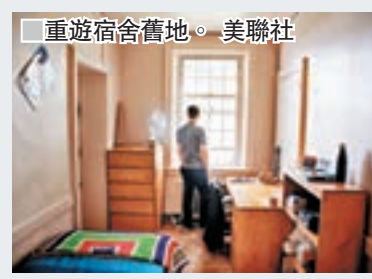
重遊宿舍舊地。

朱克伯格以自身經歷為例，指他22歲時拒絕遵照投資者和高層的要求，將fb賣盤，理由是他從不希望僅成立一間公司，而是藉公司發揮影響力，結果一度令fb分裂，當時曾懷疑自己是否太年輕，因不理解世界的運作而作錯決定，事隔多年後才了解，現今社會正因欠缺更高目標，才變得