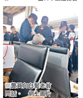
警員向白髮老翁問話。

JR西日本表示，所有受影響乘客疏散至月台，轉乘下一班列車前往目的地，肇事列車則駛往岡山市車廠檢驗，山陽新幹線服務未受影響。日本放送協會