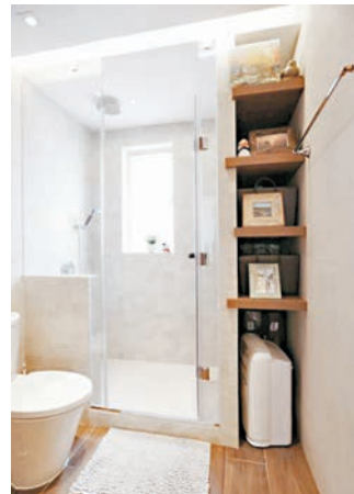
■廁所企缸採用了白色牆。