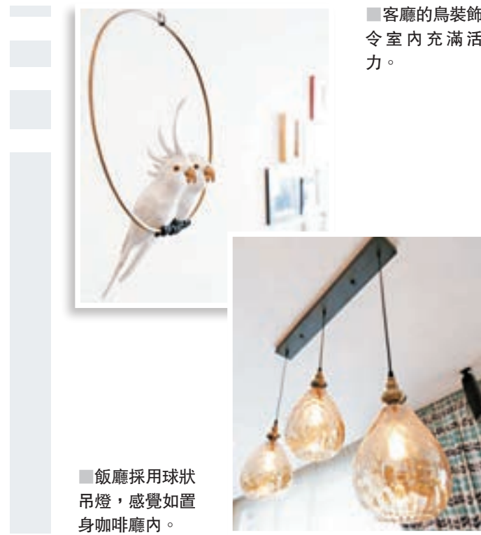
■客廳的鳥裝飾令室內充滿活力。