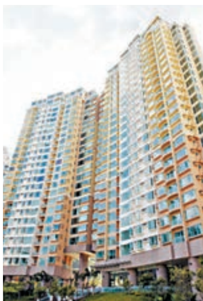
■愉景灣海澄湖畔。 資料圖片

Ivan又指，單位面向海景及部分山景，景觀相當開揚，且採光明亮，加上這個單位最大的優點是擁有以落地玻璃摺門分隔的寬闊露台，除了可讓屋主和朋友們在假日時一起燒烤外，在設計上其空間還可「錯覺地帶入屋內」，令屋內的空間感大大提高。另外，在選色上都巧妙地將屋外的顏色用到屋內傢俬及牆身，例如大自然的Earth-tone 色系及海洋的藍色，令屋內外融和在一起，亦有助整個空間感覺上更加寬敞和舒服。