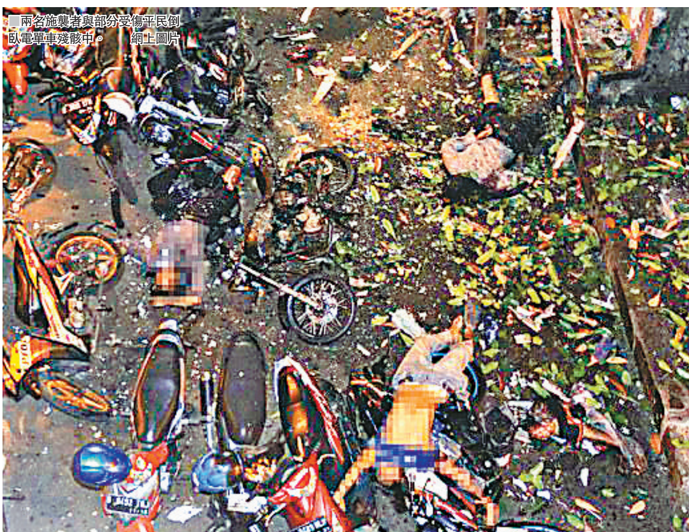
兩名施襲者與部分受傷平民倒臥電車殘骸中。網上圖片