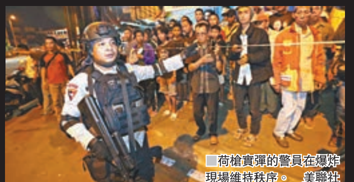
荷槍實彈的警員在爆炸現場維持秩序。