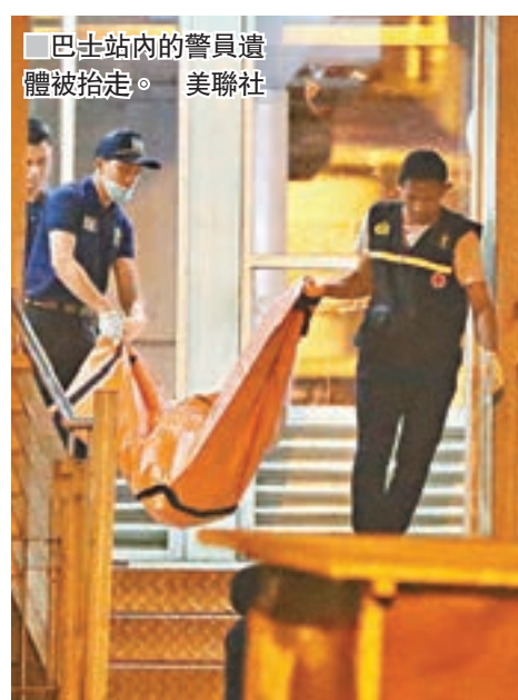
巴士站內的警員遺體被抬走。