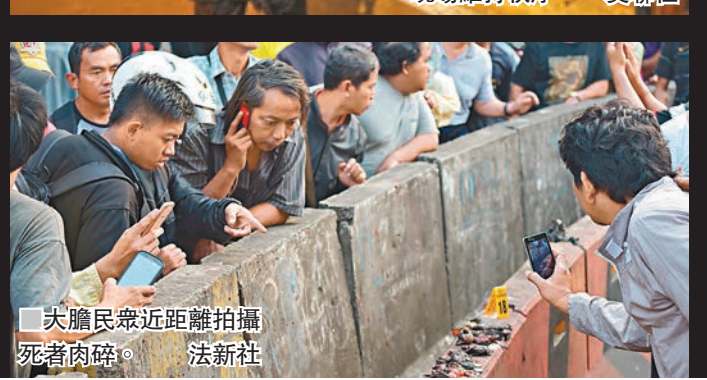
大膽民眾近距離拍攝死者肉碎。