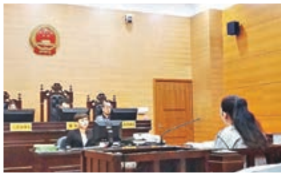
沈威拒不認罪，但願意賠償投資人本金求輕判。