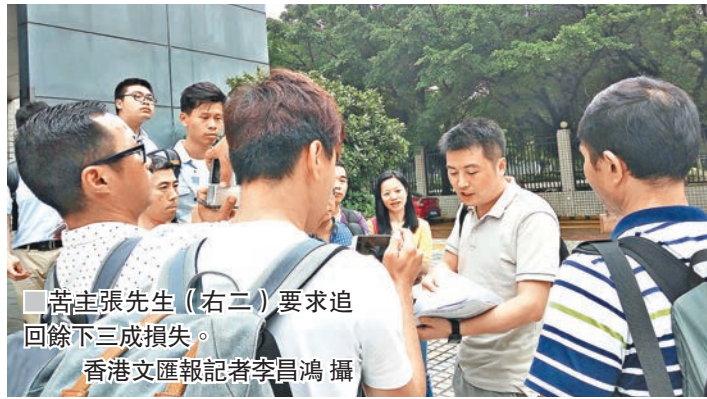
苦主張先生(右二)要求追回三成損失。