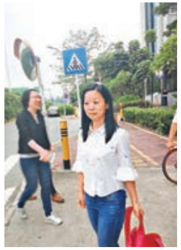
鄒小姐表示，美貸網如真心賠償就要拿出誠意。