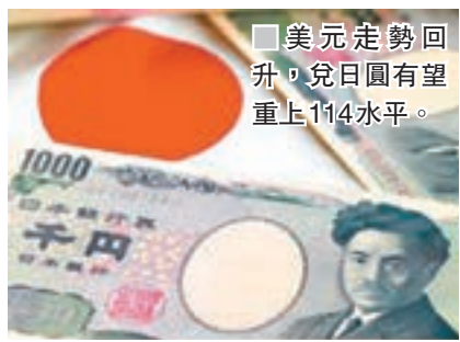
美元走勢回升，兌日圓有望重上114水平。

國際評級機構穆迪週三下調中國長期本幣和外幣發行評級，從Aa3下調至A1，並將評級展望從負面調整為穩定。此次評級下調反映了穆迪預計未來幾年中國的財政實力會受到一定程度的損害，經濟體系整體債務將隨著潛在增長的放緩而繼續上升。 周二美元兌主要貨幣從六個月低位反彈，得益於美債收益率上升；人民幣下跌，此前穆迪出於對中國債務激增的擔憂，下調了中國評級。美元脫離周一所及的11月9日以來低點96.797，當時圍繞特朗普競選團隊與俄羅斯勾結的擔憂打壓美元。