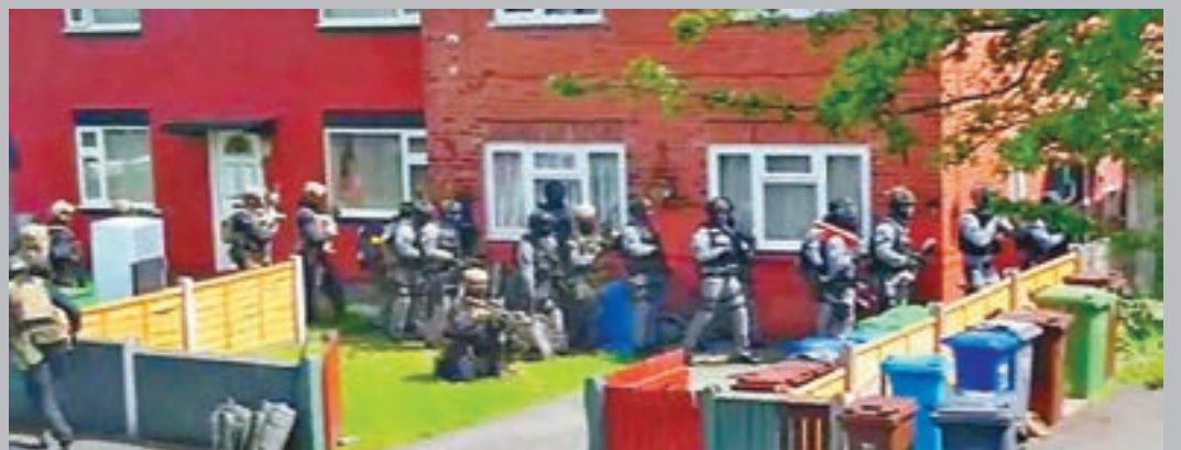
當局派員搜查阿貝迪的住所。