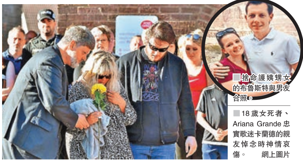
捨命護姨甥女的布魯斯特與男友合照。