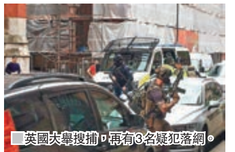
英國大舉搜捕，再有3名疑犯落網。