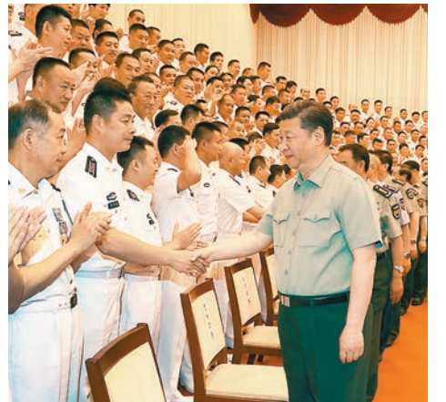
■習近平視察海軍機關，接見海軍第十二次黨代會全體代表和海軍機關正師職以上領導幹部。

習近平指出，海軍要貫徹國家安全戰略和軍事戰略要求，科學統籌和推進海軍轉型建設。要強化作戰需求牽引，堅持實戰實訓、聯戰聯訓，把戰鬥力標準貫穿海軍轉型建設全過程和各方面。要堅持體系建設，統籌機械化和信息化建設，統籌近海和遠海力量建設，統籌水面和 underwater、空中等力量建設，統籌作戰和保障力量建設，確保形成體系作戰能力。要堅持創新驅動，為海軍轉型建設注入強大動力。要堅持依法治軍。要堅持從思想上政治上建強海軍。