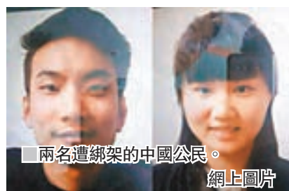
■兩名遭綁架的中國公民。

及卡拉奇領館啟動突發事件應急響應，與當地政府保持密切溝通，盡快確認被綁人員信息並進行解救。