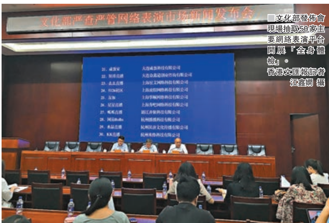
■文化部發布會現場抽取50家主要網絡表演平台開展「全身體檢」。

香港文匯報訊 (記者 江鑫燭 北京報道) 針對近期網絡表演市場違規行為多發問題，文化部昨日舉行發佈會稱，已關停10家網絡表演平台，行政處罰48家網絡表演經營單位，關閉直播間30,235間，整改直播間3,382間，處理表演者31,371人次，解約547人。其中，「花椒」平台因虛假故宮直播事件被行政處罰。目前，文化部正在部署開展對「YY」、「花椒」、「龍珠」等50家網絡表演經營單位的「全身體檢」。另外，為嚴打直播平台「涉黃」，還將建立主播「黑名單」制度，違規者全行業禁入。