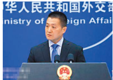
■陸慷表示，任何中國公民、對於任何事的表態都應該負責任。

香港文匯報訊 據中新社報道，中國外交部發言人陸慷昨日在例行記者會上，被問及中國留學生周日在美國馬里蘭大學發表了讚揚美國空氣較中國新鮮的演講，引發中國內地憤怒情緒時表示，任何中國公民、對於任何事的表態都應該負責任，不僅是有關中國的問題，對任何問題都應該如此。 至於中國駐美使領館是否介入此事，以及中國政府是否因此發佈針對留學生的指導性意見，陸慷表示，「我沒有聽說這樣的情況」。 陸慷又表示，很多網民都認為，任何國家都有自己值得驕傲的一面，同時每個國家在發展過程中也都存在一些發展中的問題，一個公民在評論自己國家時是在什麼樣的場合、以什麼樣的方式作評論，相信所有人都不難從中感受到他/她對祖國是什麼樣的感情。 據稱，該學生後來又說自己熱愛祖國，也願意在學成之後回國為祖國作出貢獻。陸慷對此表示，「只要他們最終還是從心底熱愛自己的國家，願意為祖國作出貢獻，我相信中國政府是鼓勵、支持和歡迎的。」