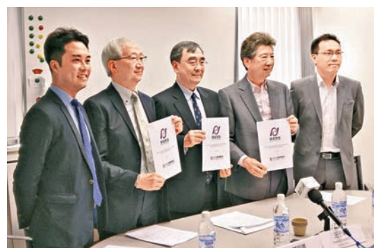
「民主思路」昨宣佈與香港大學專業進修學院合辦「資深行政人員文憑(政治領袖)課程」。

香港文匯報訊(記者 鄭治祖)香港欠缺有系統的專業培訓兼課程，「民主思路」決定成立香港政治及行政學苑，希望為香港培訓具質素的年輕