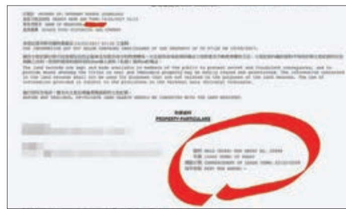
「溫鞭」上載一張年期超越2047年的土地契約，批評傻根的「大限」論。

言論備受批評，「溫鞭」在留言中就辯稱，「我從來不代表普羅和MR(MyRadio)，我說的只是法律原則。選舉期間，我忘(忙)於應付刑事審訊，沒有與任何候選人討論這觀點，僅與兩、三個朋友提及……我曾草擬flow chart(流程圖)解釋