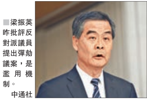
梁振英昨批評反對派議員提出彈劾議案，是濫用機制。中通社