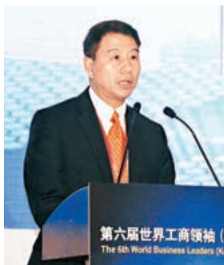
世界貿易組織(WTO)副總幹事馬俊表示，今年貿易增長勢頭加強。

香港文匯報訊(記者 賀鵬飛 昆山報道)「第六屆世界工商領袖(昆山)大會」日前在江蘇昆山舉行，與會的工商領袖呼籲各國共同維護和推動全球貿易自由化，抵制新的貿易壁壘形成。