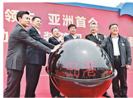
世界最先進、亞洲首個真正意義上的全自動化集裝箱碼頭正式投入商業運營。

香港文匯報訊(記者 丁春麗 山東報道)載箱量13,386TEU的集裝箱船「中遠法國」日前在青島港全自動化集裝箱碼頭106泊位靠泊作業。