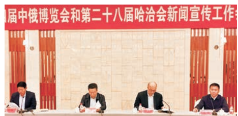
新聞宣傳工作會議現場。

截至5月14日，已有41個國家和地區的企業確認參展，與在黑龍江省舉辦的第二屆中俄博覽會相比，參展國別增長95%，國外參展企業確認展位691個，合計淨展覽面積6,219平方米，展覽面積佔整個A、B、C展廳面積的一半。吉爾吉斯斯坦、緬甸、土耳其、奧地利、塞浦路斯、巴西、馬里、烏干達、肯尼亞均為首次參展。