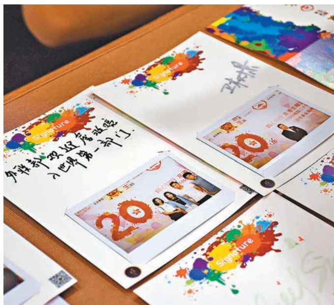
港生為慶祝香港回歸祖國20周年留下寄語。

香港特區政府駐京辦主任傅小慧致辭時也表示，「香港回歸祖國20周年，標誌着香港發展的里程碑。在座很多年輕人都出生於1997年，是名副其實的『回歸寶寶』，你們跟香港一起成長，是香港的未來，希望你們以青春和熱情，一起推動香港與內地同心創前路，掌握新機遇。」