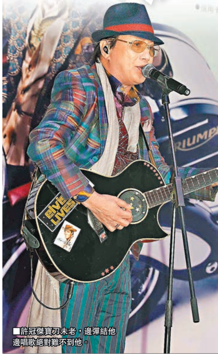
許冠傑寶刀未老,邊彈給他邊唱歌絕對難不到他。

昨日阿Sam和阿倫以演唱會海報造型現身,二人先合唱廣東串燒歌,阿Sam彈結他後再合唱英文歌,擅搞氣氛的阿倫便叫現場嘉賓企起身,儼如為8月演唱會熱身。今次的宣傳海報,是他倆坐在開蓬古董電單車上展示開心模樣,阿倫指原先的構思是在高速公路奔馳,沿途有他們的歌名飛出來,可是歌曲真的太多,整條路放不下,遂改變構思。當司機問阿倫會否坐不進去?阿Sam即說坐得落,阿倫就講笑謂:「要好大工程,加闊座位來拍!其實阿Sam是我唯一偶像,他1971年在大球場的演唱會是坐開篷車出場,所以今次