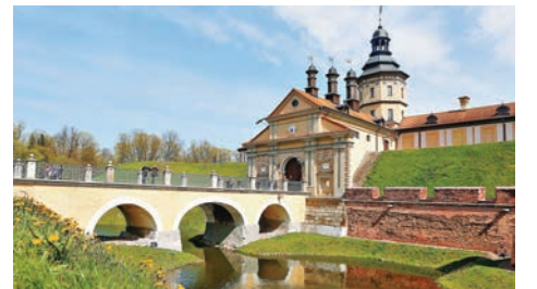
持有公務護照的中國公民可在白俄羅斯短期停留30日。圖為白俄羅斯涅斯維日城堡。資料圖片

香港文匯報訊 據澎湃新聞引述俄羅斯衛星網報道,白俄羅斯總統新聞處前日發佈消息稱,白俄羅斯總統盧卡申科簽署了向中國公務護照持有者提供免簽的命令。據悉,該文件規定,持有公務護照的中國公民可免簽出入白俄羅斯並在那裡中轉,還可在30日內在白俄羅斯境內做短期停留。