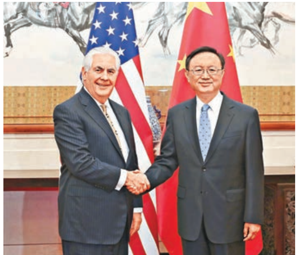
楊潔篪昨日同蒂勒森通電話,雙方表示願共同做好首輪中美「外交安全」對話的籌備工作。圖為今年3月時楊潔篪在北京釣魚台國賓館會見蒂勒森。資料圖片

劉卿指出,中美兩國元首會晤後,雙方達成的一些協定和機制都在陸續「務實」展開,也取得一定成果。經貿方面中美百日談判在展開,「一帶一路」峰會雙方也宣佈一些具體成果。政治互信方面兩國元首多次通話,「可以說,與中國發展關係,是特朗普上任一百多天後最亮麗的成績單。」劉卿說,中美外交與安全對話機制下,雙方各層級對話還會繼續展開,進一步充實中美關係。