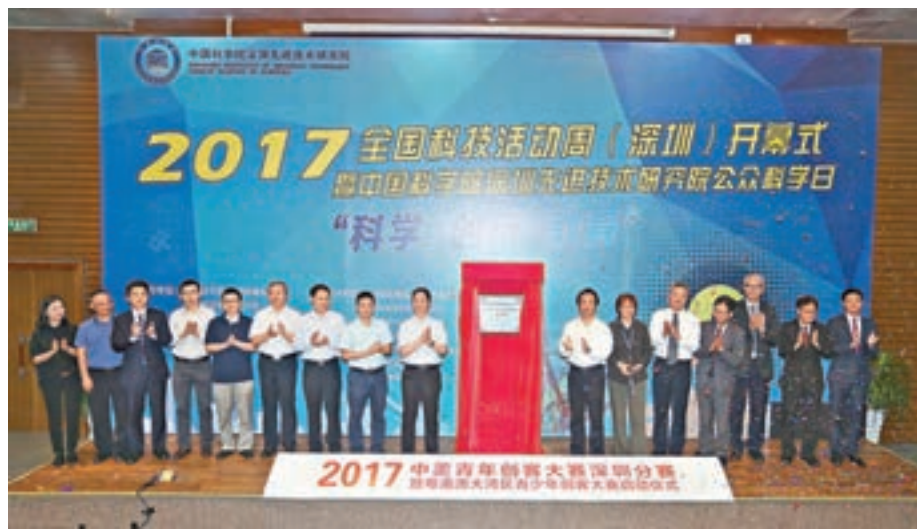
粵港澳大灣區青少年創新科學教育基地昨日揭牌。

「高端科研資源科普化」為目標,同時參與、開展雙創教育活動與研學活動,爭取通過三年至五年的建設,覆蓋粵港澳大灣區超過百家中小學。據悉,首批交流活動將於7月初舉行,香港20所中文學校的120名學生將率先參加。