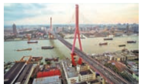
上海設立發展基金推動楊浦濱江轉型。圖為上海楊浦浦新橋。資料圖片

香港文匯報訊(記者 章蘿蘭 上海報道)上海正在大力推動城市更新,並於昨日正式設立規模高達百億元人民幣的楊浦濱江城市更新發展基金,旨在助推中國近代工業文明的發源地向「世界級一流濱水區域」轉型發展。