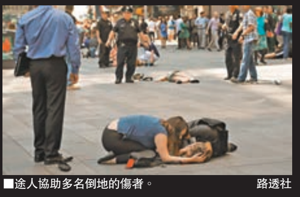
途人協助多名倒地的傷者。

戈麥斯續指，紐約警方已經擁有最先進武器和科技，但仍無法阻止今次事件發生，代表恐怖分子隨時可駕駛重型貨車，到時代廣場蓄意撞向途人，甚至引爆車上炸彈，造成重大傷亡。 ■哥倫比亞廣播公司