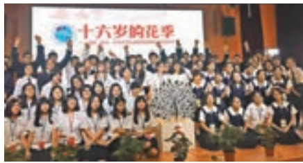
兩岸三校的中學生合影留念。

香港文匯報訊（記者 田雯 南京報道）5月18日至今日，「十六歲的花季」南京·新北·台東中學生校園體驗營活動在江蘇南京舉行。來自台灣新北金陵女中、台東女中的41名中學生在南京金陵中學體驗大陸校園生活，並參訪中山陵等歷史文化景觀，活動期間居住在陸生家中，零距離感受南京市民的家庭生活，也讓兩岸學生有更多時間交流，建立更深的友誼。