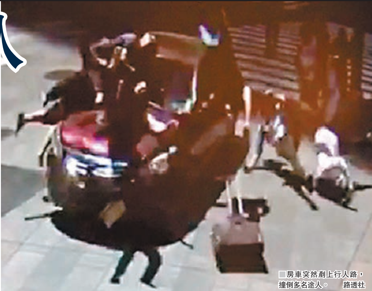
房車突然剷上行人路，撞倒多名途人。