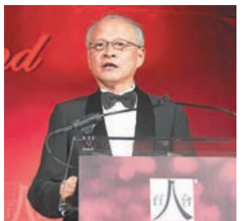
中國駐美大使崔天凱日前出席美國百人會時表示,互聯互通對推進中美關係發展具有重要意義。