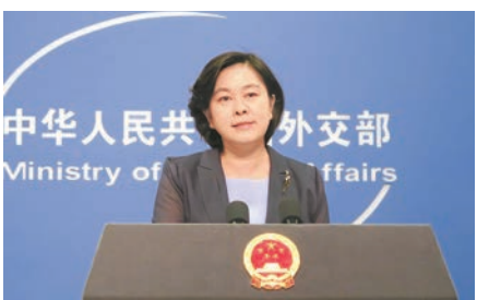
外交部發言人華春瑩表示,美方應尊重中方合理安全關切。