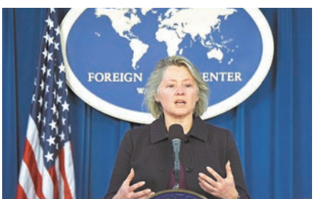
美國代理助理國務卿蘇珊·桑頓將於5月25日至26日訪華。