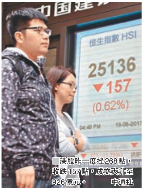
港股昨一度挫268點，收跌157點，成交大升至926億元。

香港文匯報訊(記者 周紹基)美國總統特朗普的政治危機繼續發酵，成為大市的「黑天鵝」，拖累美股大挫不止，港股也隨跟裂口低開259點，曾低見25,025點。但大市在25,000點有支持，主要因為騰訊(0700)季績勝預期，加上獲市場唱好，「最牛」看騰訊315元，令該股逆市揚升，大市跌幅一度收窄至不足30點。恒指全日跌157點，收報25,136點，成交大升至926億元。 大行唱好 里昂「最牛」看315元 由於季績理想，多間大行遂上調騰訊的目標價至300元之上，當中以里昂「最牛」，給予315元目標價，令該股先跌後升，最高曾升4.5%衝上271.4元上市新高，全日則收報264元，升幅收窄至1.62%，但仍再創盤中及收市新高。全日共有143.7億元資金掃貨，使騰訊市值升至2.5萬億元。