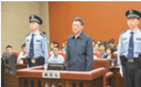
江蘇原省委常委、秘書長趙少麟(前排左二)被判處四年有期徒刑。網上圖片

香港文匯報訊 綜合中通社及央視網報道，浙江省寧波市中級人民法院昨日公開宣判江蘇原省委常委、秘書長趙少麟單位行賄、騙購外匯一案，對被告人趙少麟以單位行賄罪判處有期徒刑三年；以騙購外匯罪判處有期徒刑二年，並處罰金人民幣1,500萬元(人民幣，下同)，決定執行有期徒刑四年，並處罰金1,500萬元。