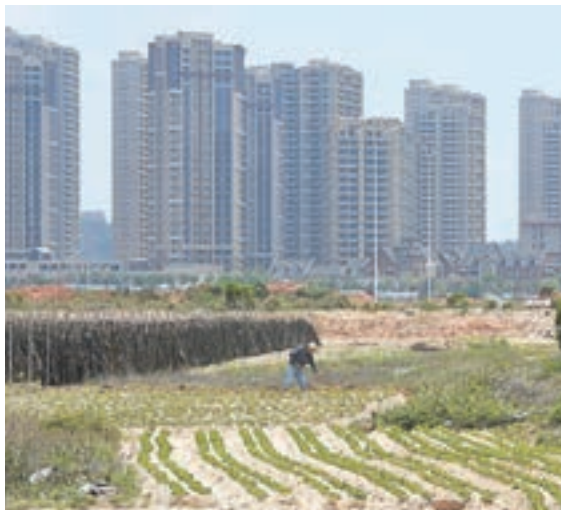
官方數據顯示，4月70個城市中有23個城市新建商品住宅價格漲幅比上月回落，比3月份增加13個。圖為福建省莆田市部分樓盤。

劉建偉續指，一、二線城市房價漲幅收緊，三線城市漲幅擴大。其中，一線城市新建商品住宅價格同比漲幅連續7個月回落，4月份比3月份回落2.8個百分點；二線城市新建商品住宅價格同比漲幅連續5個月回落，4月份比3月份回落1.0個百分點；三線城市新建商品住宅價格同比漲幅略有擴大，4月份比3月份擴大0.4個百分點。