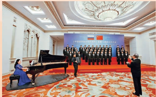
■ 《中俄睦鄰友好合作條約》簽署15周年紀念大會

產管理，在2009-2014年多次被文化部、商務部、中宣部、財政部等授予「國家文化產業示範基地」和「國家文化出口重點企業」榮譽。 時至今日，柏斯音樂集團的樂器製造「版圖」已擁有跨越中德的九大生產基地，生產包括鋼琴、電鋼琴、吉他、打擊樂等多類產品，為中國樂器的全面騰飛與發展提供了巨大動力。