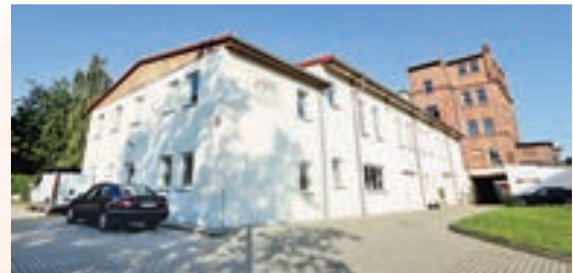
■ 德國圖林根Wilh. Steinberg 鋼琴生產基地

「長江鋼琴」是柏斯音樂集團出品的擁有獨立知識產權的高端中國鋼琴品牌，是世界首個用「漢字」作為品牌標識的鋼琴品牌。 2009年，已經具有成熟鋼琴生產經驗的柏斯音樂集團，以民族榮譽為理念支撐，決定創立一個「代表中國製造」的高端鋼琴品牌。自研發創立起，柏斯音樂集團即以「高起點、高品質、高科技」為研發策略，並通過在北美購買雲杉木材，在煙台建立木材加工基地；跨國收購德國百年鋼琴企業；引進國際先進設備；聘請海外專家等舉措保障產品品質。 經過多年研發，以甄選中國一代偉人毛澤東手書「長江」二字為命名的「長江鋼琴」榮耀問世。出品以來，長江鋼琴以優質的演奏性能被數