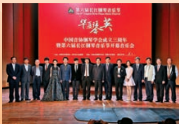
■ 「柏斯音樂基金會」促成香港與宜昌在校師生牽手舉行「長江鋼琴音樂節」

為支援高校音樂教育，捐助高校教育基金，創立「長江鋼琴獎學金」；為促進教育資源平衡，慷慨捐贈教學設備、參與培訓鄉村教師；為普及音樂文化，創建藝術培訓學校、舉行音樂會和大師班、組織音樂名家進社區。