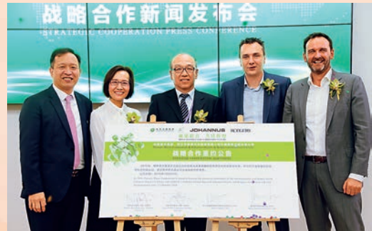
■ 2016中國(上海)國際樂器展覽會柏斯音樂集團-荷蘭友翰管風琴製造有限公司及美國羅傑斯樂器公司戰略合作新聞發佈會

百位國內外名家選定為音樂會或大師班用；同時更榮獲「中國國際與名牌博覽會特別金獎」、「中國輕工精品展創新獎」等眾多品質大獎。2014年和2016年長江鋼琴更分別以亮相「第三屆中國深圳國際鋼琴協奏曲比賽」和登台《中俄睦鄰友好合作條約》簽署15周年紀念大會，成為了世界認識中國製造的又一個響亮符號。