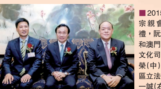
■ 2015年阮氏宗親會就職典禮，阮建昆博士和澳門特區社會文化司長譚俊榮（中）及澳門特區立法會主席賀一誠（右）合照。