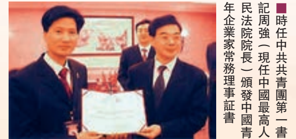
■ 時任中共青島團第一書記周強（現任中國最高人民法院院長）頒發中國青年企業家常務理事證書。

八十年代初期，只有17歲的阮建昆博士提着簡單的行李從中山移居到澳門，在陌生的城市裡，他先從製衣學徒做起，隨後又應聘到一家傳統粵菜館工作，在八年的時間裡，憑着用心、誠懇及勤奮的工作態度，從服務員晉升為店鋪經理，掌管酒家業務和員工管理，贏得酒家老闆的重視和信任。