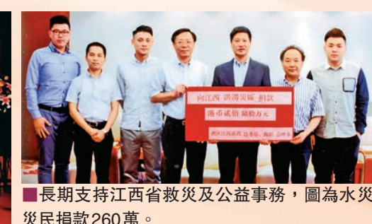
■ 長期支持江西省救災及公益事務，圖為水災災民捐款260萬。