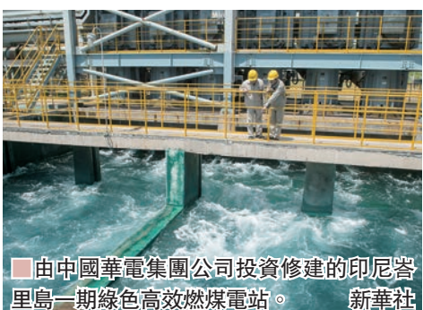
由中國華電集團公司投資修建的印尼峇里島一期綠色高效燃煤電站。