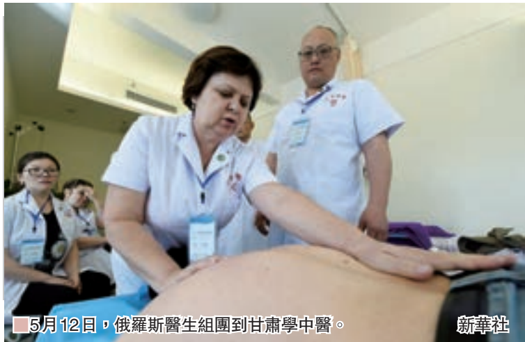
5月12日，俄羅斯醫生組團到甘肅學中醫。

在「一帶一路」國際合作高峰論壇「增進民心相通」平行主題會議上，全國政協委員、國家中醫藥管理局局長王國強表示，中國將與「一帶一路」沿線國家合作建設30個中醫藥海外中心，頒佈20項中醫藥國際標準，建設50家中醫藥對外交流合作示範基地。