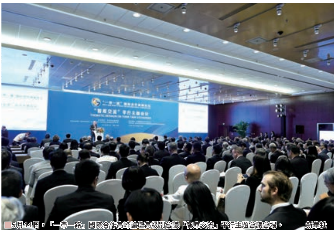
5月14日，「一帶一路」國際合作高峰論壇高級別會議「智庫交流」平行主題會議會場。新華社

以高峰論壇為平台推進務實合作，「一帶一路」峰會簽署多項合作協議，成果清單達270多項。全國政協委員、中國企業評價協會