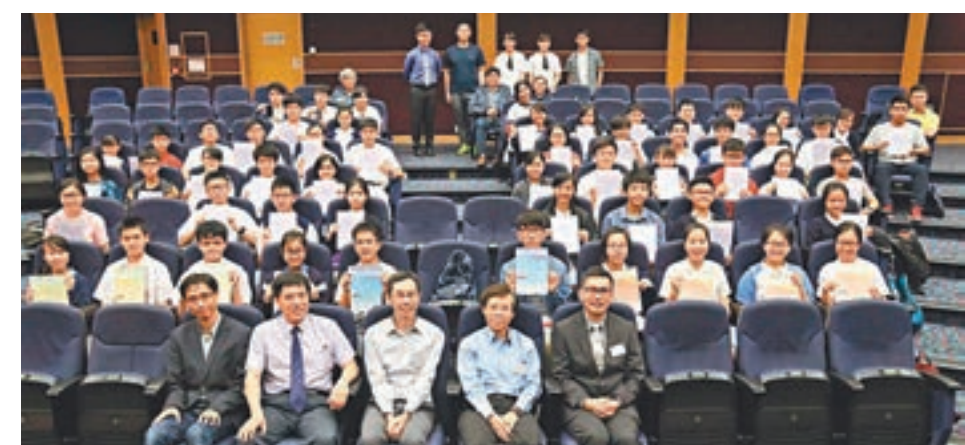
「中學生天文訓練計劃」畢業生合照。

本年度「中學生天文訓練計劃」反應踴躍,逾200人報名,主辦單位根據學生參加計劃原因、天文知識、經驗、興趣、態度等因素,取錄約70人。計劃涉及大學程度知識,理論方面,參與學生需要學習一般天文現象、曆法、計算望遠鏡性能及分析和預測恒星光譜等;實踐方面,同學需要了解天文儀器性能及掌握使用技巧,儀器