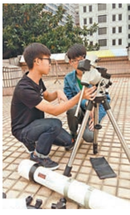
同學於太空館天台,進行望遠鏡組裝訓練。

包括雙筒望遠鏡、不同設計的望遠鏡、赤道儀等,更需在10分鐘內完成赤道儀的組裝,例如用北極星調校赤道儀平行於地球極軸、安全地安裝重鏡及望遠鏡、平衡經緯重量以及對齊主鏡和尋星鏡。同學需參與一系列由資深香港天文學會講者負責的工作坊,內容涵蓋以何鴻燊天文觀星象投影系統講解四季星空等。