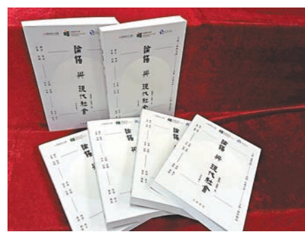
《論語與現代社會》。