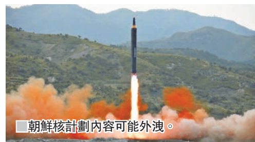
朝鮮核計劃內容可能外洩。

英國國家醫療服務系統(NHS)是今次網攻的重災區，多個電腦系統癱瘓，部分病人需轉送至其他醫院。NHS 英格蘭全國事故總監