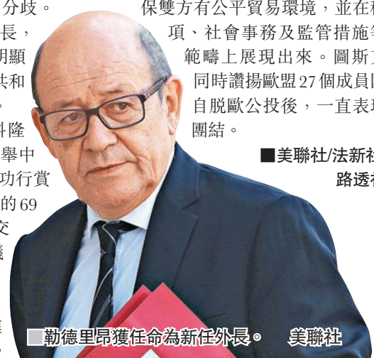
勒德里昂獲任命為新任外長。