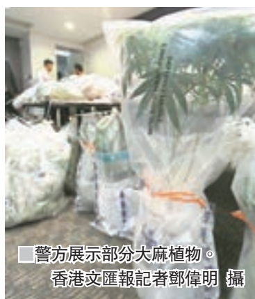
警方展示部分大麻植物。