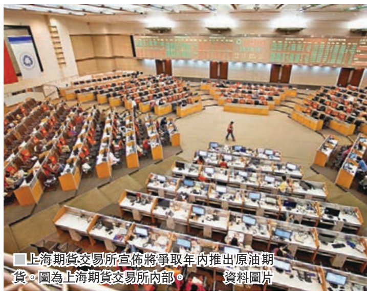
上海期貨交易所宣佈將爭取年內推出原油期貨。圖為上海期貨交易所內部。

香港文匯報訊（記者 章蕞蘭 上海報導）上海期貨交易所昨日正式對外發佈的《原油期貨規則合約答記者問》中明確提及，在積極穩妥完成各項上市準備工作後，能源中心將爭取年內推出原油期貨。這將是內地期貨市場首個對外開放的品種。據悉，原油期貨選擇中質含硫原油作為交割標的，並對個人客戶設置50萬元（人民幣，下同）的門檻，對單位客戶設置100萬元的門檻。