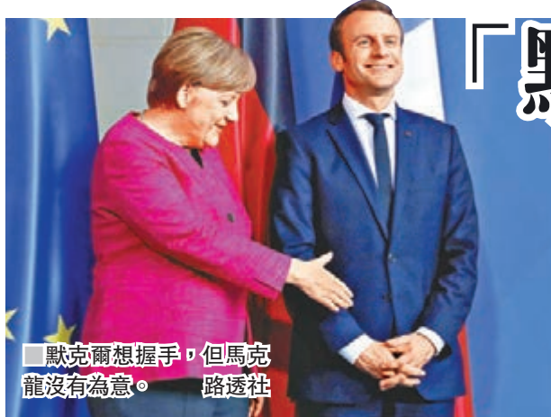
默克爾想握手，但馬克龍沒有為意。