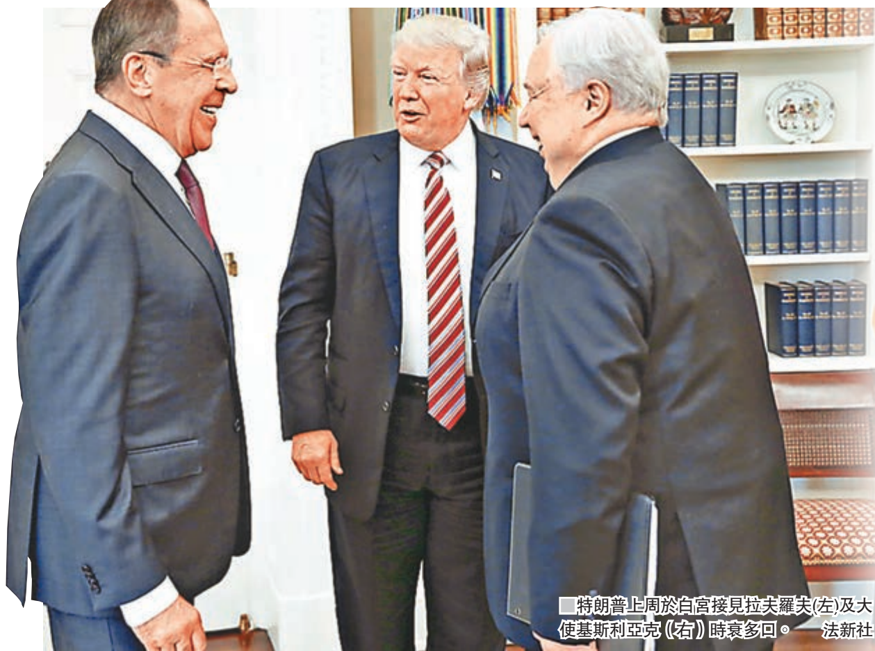
特朗普上周於白宮接見拉夫羅夫(左)及大使基斯利亞克(右)時多回。