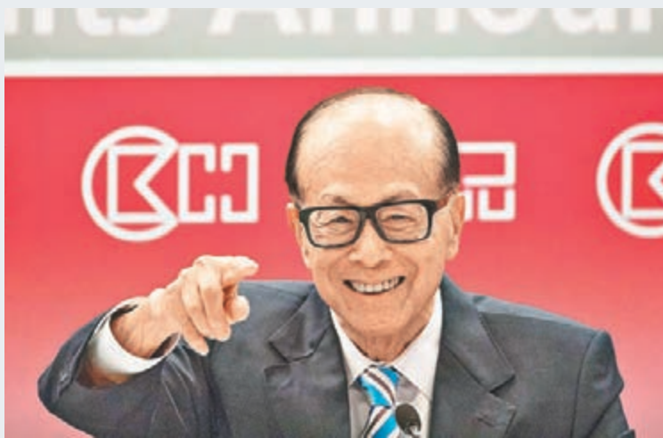
市傳李嘉誠計劃將和記電訊旗下從事固網業務的和記環球電訊出售。資料圖片

香港文匯報訊(記者 蔡競文、梁悅琴)剛於上周股東大會說過「香港市場細，難以再大幅增加在香港投資」的香港首富李嘉誠，昨傳出他計劃將和記電訊(0215)旗下從事固網業務的和記環球電訊(HGC)出售的消息，預計作價逾10億美元(約78億港元)。長和發言人昨表示對市場傳聞不作評論。