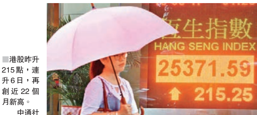
■ 港股昨升215點，連升6日，再創近22個月新高。

香港文匯報訊 雖然隔夜美股繼續走低，但「股王」騰訊(0700)昨日再見新高，加上匯控(0005)和多個中資藍籌股均走勢堅挺，推動港股繼續上升。恒指昨日收市報25,371.59點，升215點或0.86%，已連升6個交易日，累漲895點，再創近22個月新高。成交金額亦增至812.7億元。國企指數收報10,450點，升1.63%。分析員對港股本周走勢持樂觀看法，料可企穩於25,000點以上水平。