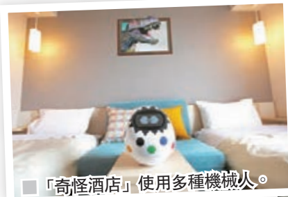
「奇怪酒店」使用多種機械人。

日本主要機械人生產商近年訂單數量持續增加，今年1月至3月收入更是數季以來首次錄得增長。川崎重工指，日本目前大部分中小企均未採用機械人，市場潛力極大，公司特別為中小企設計相應的機械人，例如一款高170厘米的雙臂機械人，便可用於生產電子器材、加工食品或製藥。日立建機的電腦控制挖泥機則內置全球定位系統，可以將挖泥深度的準確度控制在數厘米內，所需時間快人手一半，因此獲愈來愈多企業問津。