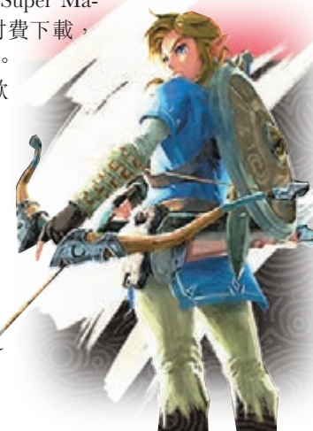
手遊版《薩爾達傳說》或年內現身。