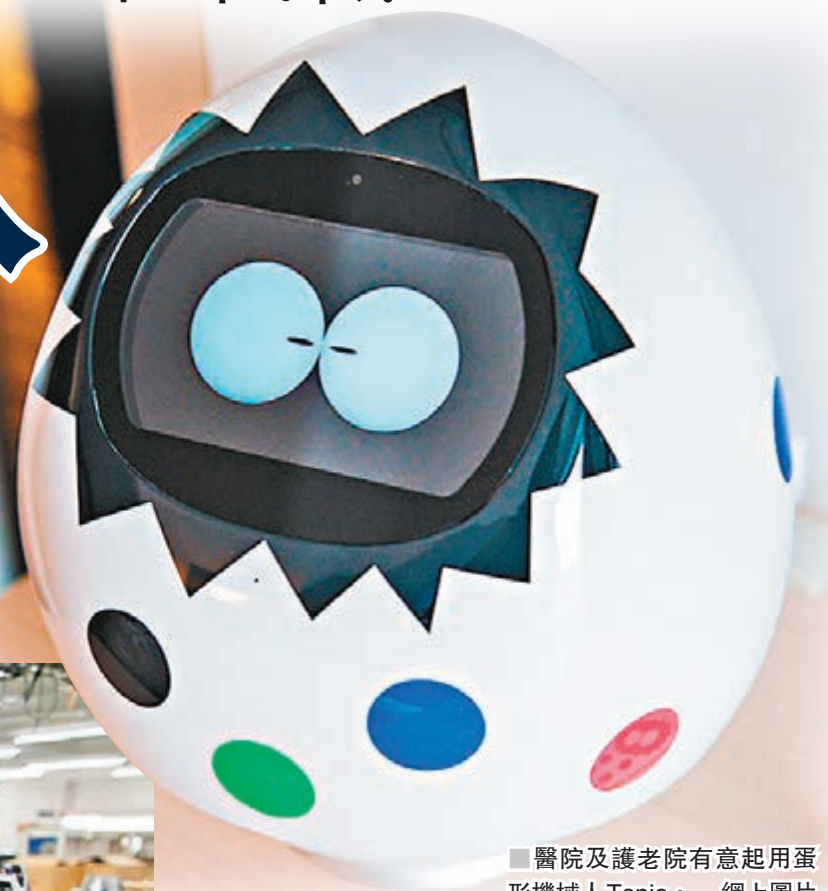
醫院及護理院有意起用蛋形機械人Tapia。網上圖片