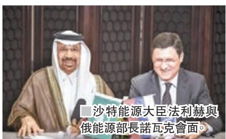
沙特能源大臣法利赫與俄能源部長諾瓦克會面。

沙特阿拉伯能源大臣法利赫與俄羅斯能源部長諾瓦克昨日會面，雙方傾向將限制石油產量的協議延長 9 個月，直至明年第一季結束為止，有關建議將於下週四舉行的石油輸出國組織(OPEC)會議上討論。消息刺激紐約油價升 2.2%，至每桶 48.88 美元，倫敦布蘭特期油亦升 2.1%，報每桶 51.88 美元。