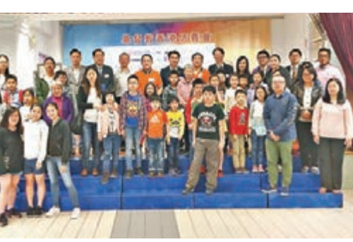
「睛彩人生·學童護眼計劃2017」，賓主與驗眼學童合照。

基層學童往往因經濟問題忽視護眼的重要性，沒有定期作視力檢查或佩戴合適眼鏡，甚至有眼疾亦未能及時求診而令視力問題惡化。「睛彩人生·學童護眼計劃2017」，旨在為有需要的基層學生提供驗眼服務，並為合資