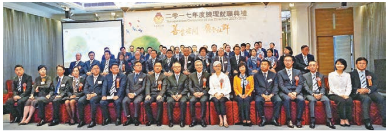
九龍樂善堂2017年度總理就職典禮，賓主合影。