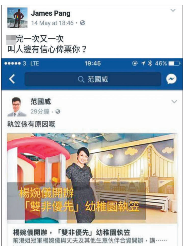
「咖喱飯」用「內容農場」的流料抽水係抵笑，但誰會估到截圖圍踩那位是「自己友」公民黨的人？fb截圖