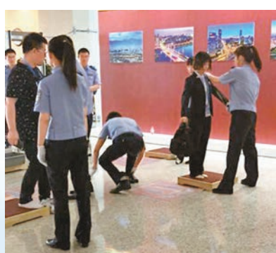
■記者進入新聞中心需要脫鞋搜身檢查。

在會見馬來西亞總理納吉布時，習近平指出，雙方要繼續加強「兩國雙園」同步建設和互動發展，穩步推進有關工業園、鐵路等大項目合作。納吉布表示，馬方願加強貿易投資、基礎設施建設、人文、反恐安全等領域合作。