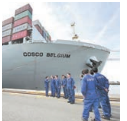
■「一帶一路」建設全面推進，便捷的通道促使沿線國經濟交往日趨活躍。圖為「中遠比利時」號抵達安特衛普港。