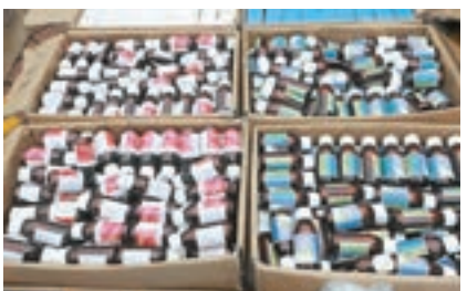
水警截獲的走私咳藥水。

香港文匯報訊(記者 杜法祖)有私車前日凌晨利用港珠澳大橋人工島西面近岸進行走私活動,企圖將多箱貨物卸下快艇時,被正在執行「雷霆十七」反走私行動的水警人員追截,其間人員在兩部七人車車廂檢獲大批電子產品及咳藥水,總值超過500萬元,惟6名可疑男子已及時跳上快艇逃去。