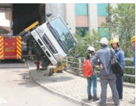
消防到場迅速將兩人救起,幸兩人仍清醒。

兩名受傷工人,其中一名姓李(36歲)工人手腳擦傷,送往瑪嘉烈醫院時頭臉均有血跡;另一名姓周(50歲)工人,肩膀及手臂受傷,被送往仁濟醫院救治。