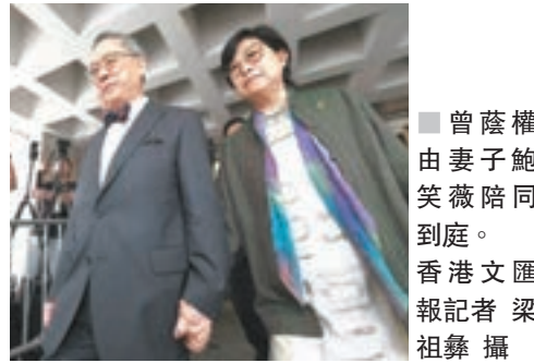
曾蔭權由妻子鮑笑薇陪同到案。

香港文匯報訊(記者 杜法祖)前行政長官曾蔭權被控收受利益的案件,昨在高等法院進行預審,案件已排期今年9月26日開審,預計審訊25天。法官陳慶偉昨開庭時頒令限制傳媒報道預審內容,只可報道法官、被告、控辯雙方律師名字,及控罪內容等。在案件開審前,法庭會於9月19日再進行另一輪預審。