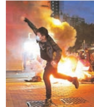
警方指證旺暴當日曾有人掙磚襲警。

他在台上用擴音器向人群作出警告,勸喻示威者離開,但人群未有理會,警方其後再將防線推前至洗衣街近油蔴地街。