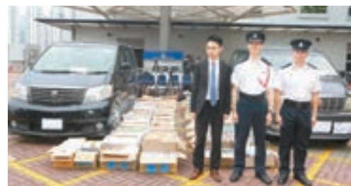
水警在兩部七人車檢獲大批電子產品及咳藥水。