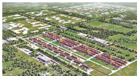
霍東特區規劃效果圖。受訪者供圖

「納扎爾巴耶夫總統提出的『光明大道』計劃與習近平主席提出的『一帶一路』倡議是一致的。」哈寶山強調，「一帶一路」倡議提出之初，當很多國家特別是歐美國家都秉持懷疑或觀望態度時，哈薩克斯坦率先對