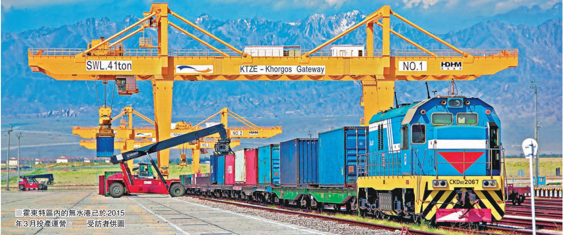
霍東特區內的無水港已於2015年3月投產運營。