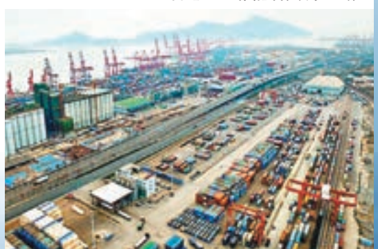
中國與哈薩克斯坦合作建設的中哈（連雲港）物流基地。