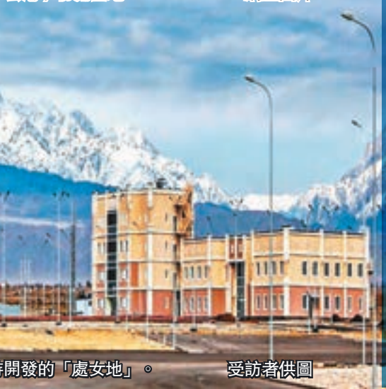
霍東特區仍是一塊有待開發的「處女地」。

霍東特區是由哈薩克斯坦總統納扎爾巴耶夫於2011年11月29日批准設立的一個全新特區，位於哈國最東部的阿拉木圖州潘菲洛夫區，總面積達4,591.5公頃，距中哈邊境的阿騰科里火車站僅有6公里，離中國霍爾果斯口岸也不過15公里。