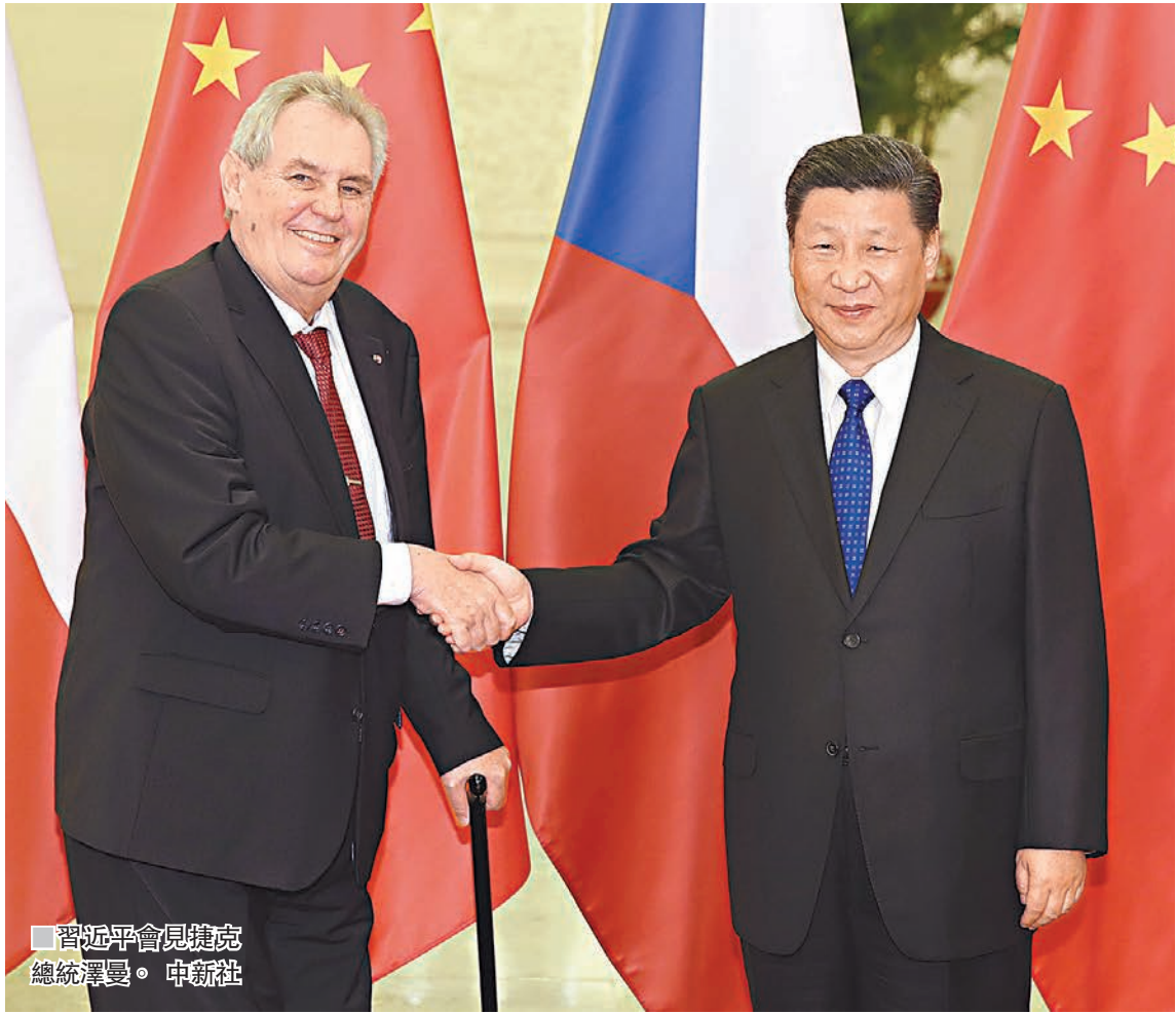
■習近平會見捷克總統澤曼。中新社

■習近平與烏茲別克斯坦總統米爾濟約耶夫在會談後簽署了《中華人民共和國和烏茲別克斯坦共和國聯合聲明》。中新社