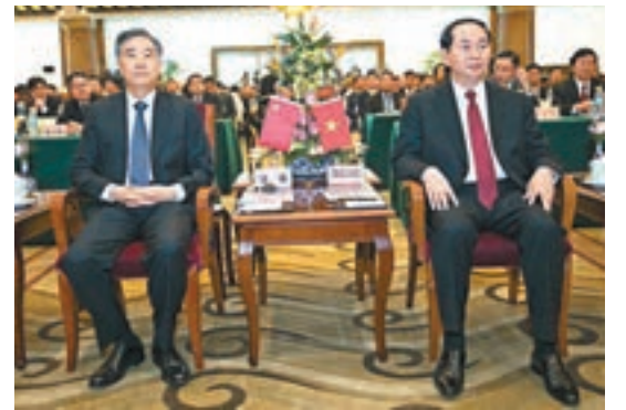
■汪洋與越南國家主席陳大光出席「2017中國—越南經貿合作論壇」。

作為此次論壇的共同舉辦方，蔡冠深致辭時表示，中國正全面開展「一帶一路」建設工作，越南作為海上絲綢之路第一站，在推進「一帶一路」建設上角色重要。而香港是海上絲綢之路的重要據點，已經連續23年被評為全球最自由經濟體，是重要的國際金融城市，在促進區域合作等方面可發揮聯繫人功能。