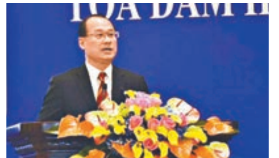
■香港中華總商會會長蔡冠深致辭。