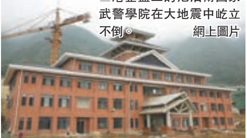
■港企監工的尼泊爾國家武警學院在大地震中屹立不倒。網上圖片

點基礎設施建設，支持兩地企業聯合「走出去」開拓「一帶一路」沿線市場;二是支持香港舉辦或參與內地舉辦的「一帶一路」相關論壇和活動，支持香港與內地各省市、行業組織開展與「一帶一路」相關的合作;三是通過CEPA進一步對香港擴大開放，便利兩地合作。