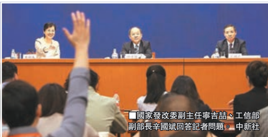
■國家發改委副主任寧吉喆、工信部副部長辛國斌回答記者問題。

國際認同，香港的獨特作用和優勢引人注目。國家發改委副主任寧吉喆昨日在國新辦記者會表示，香港在國家「一帶一路」的構想中發揮重要的平台作用，香港服務業、金融、航運、貿易中心的優勢在「一帶一路」實施中都可以更好地發揮作用。他說，正像十多年前在中國實施西部大開發戰略、向西開放中發揮了重要作用一樣，「一帶一路」中可以發揮香港的許多綜合優勢、橋樑作用，為企業更好地服務。