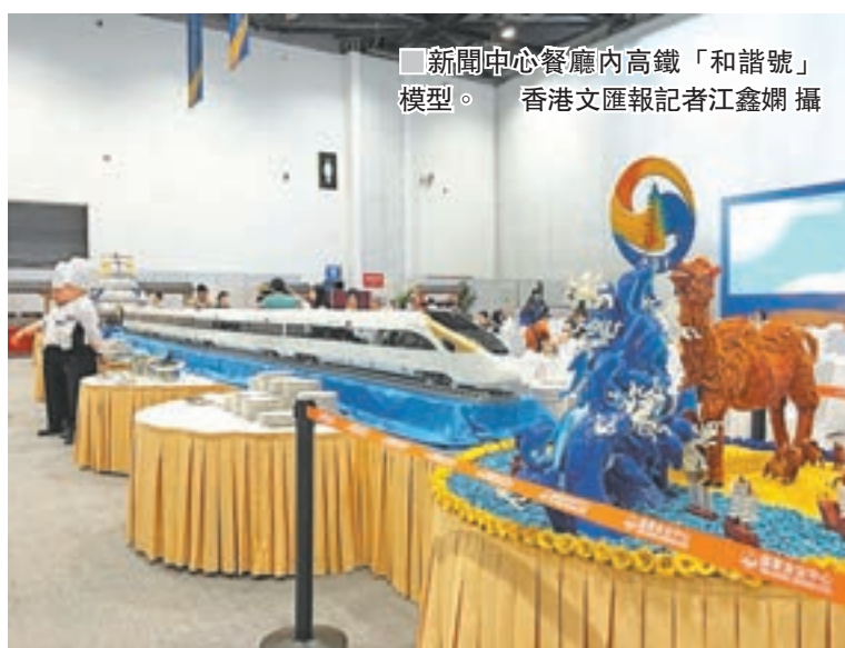
■新聞中心餐廳內高鐵「和諧號」模型。

如果遇到問題，記者隨時可以向身邊的義工求助。這些義工來自清華大學、北京大學、外交學院等重點高校，都參加過禮儀和語言等專業培訓。