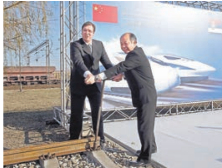
■中國企業承建的匈塞鐵路塞爾維亞段2015年底啓動。