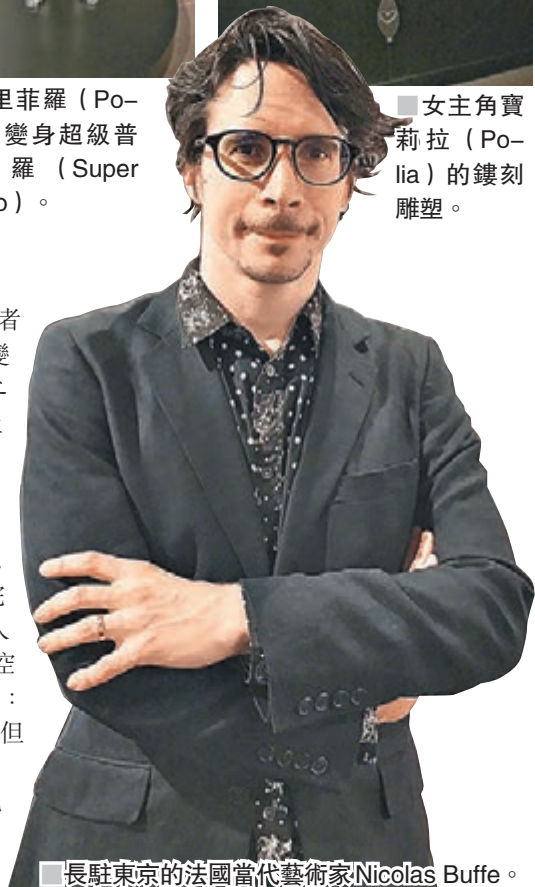
長駐東京的法國當代藝術家Nicolas Buffe。