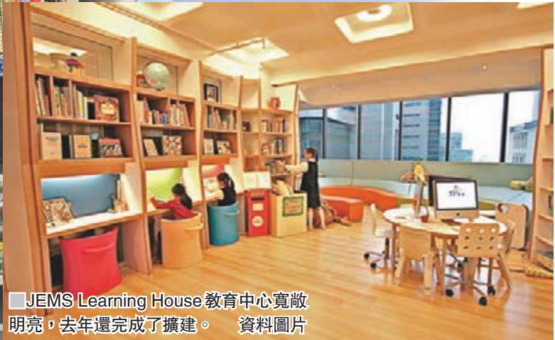
JEMS Learning House教育中心寬敞明亮，去年還完成了擴建。