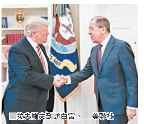
■拉夫羅夫到訪白宮。

拉夫羅夫此行首先與蒂勒森見面，討論敘利亞及烏克蘭危機，其後到訪白宮會晤特朗普，主要談到美俄關係未來走向，特朗普相信俄羅斯總統普京會協助結束敘利亞內戰，又強調今次會面氣氛良好，希望美俄建構更好關係。