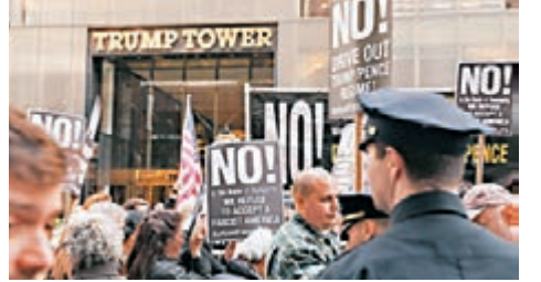
■示威者在特朗普大樓外抗議。