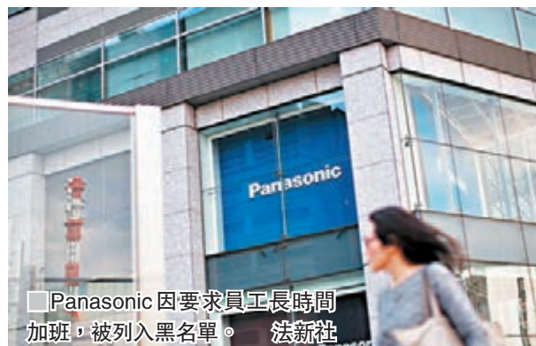
■Panasonic因要求員工長時間加班，被列入黑名單。法新社

非法移民在日本屬敏感議題，近期屢次傳出遭羈留移民待遇差劣，大阪一間羈留中心的移民被指得不到醫療照顧，先後觸發兩次絕食。路透社去年調查一名斯里蘭卡人在東京入國管理局羈留中心死亡事件，揭露當局向移民提供的治療嚴重不足，監察制度亦存在缺失。■路透社